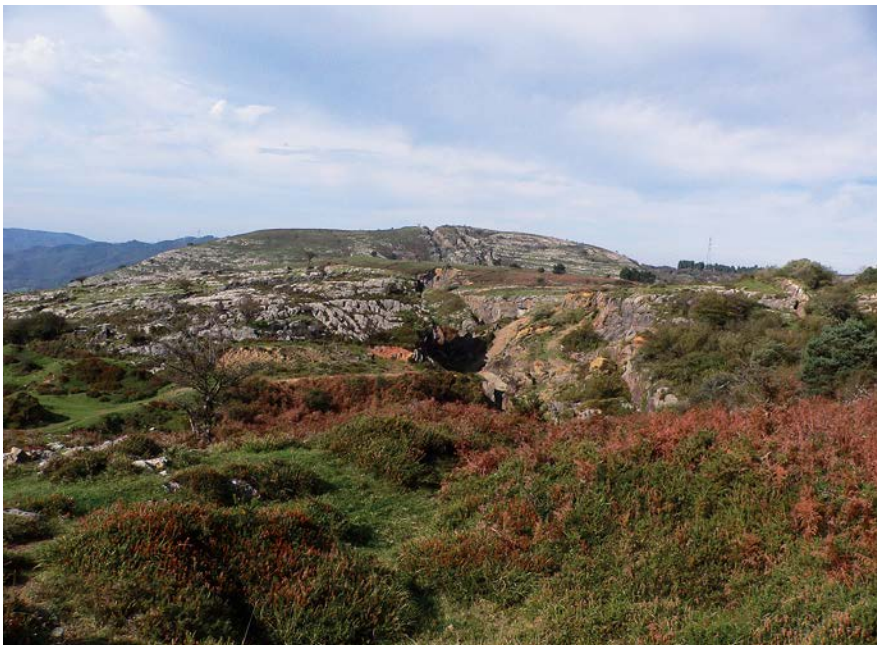
El Hundimiento deritzon lekua, lurra meatzeak irentsi zuenekoia eta inguruko karsta

📍 20,8 km. Bisita egin ostean, errepidea hartuko dugu gorantz berriro eta 200 metro igarota bihurgunean ezkerrera agertuko zaigun lurrezko bidetik hasiko gara etengabe gorantz bidetik atera barik. Hasieran, Peñas Negras zentroko seinaleztatuko ibilbide arrosa eta lilarekin batera egingo dugu aurrera. Urjauzi txikia eta iturria atzean utzi eta gorantz, La Breña mendi lepora heldu arte.