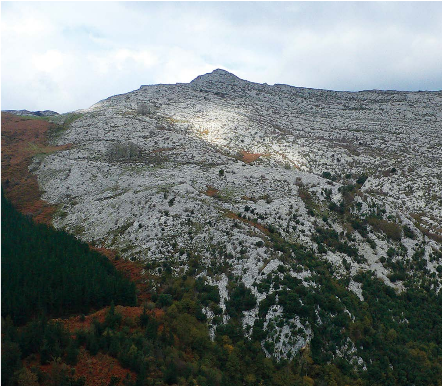
Cueto auzotik igaro ondorengo ikuspegiak (Jorrios mendia)