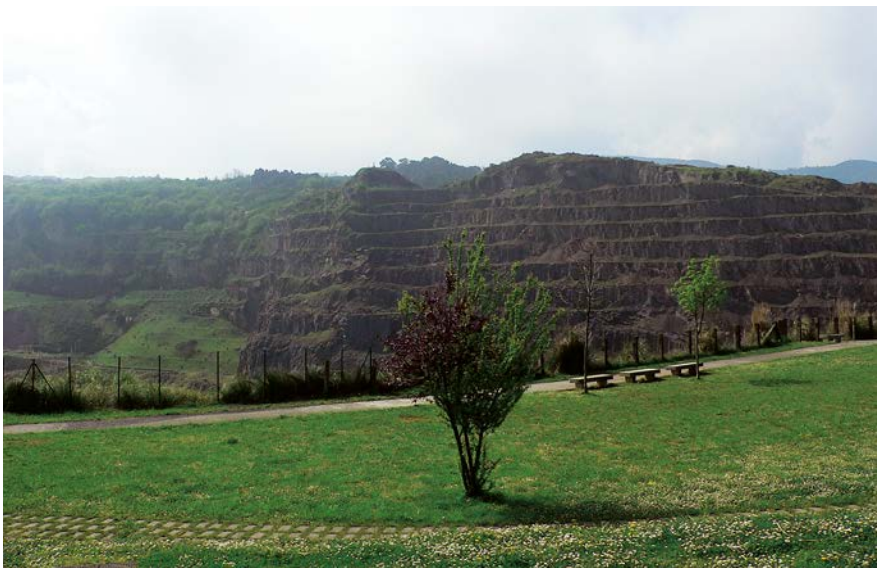
Kontxa 2 aire zabaleko meategia. Gallarta auzoa lehen zegoen orubean

📍 46,0 km. Bidegurutzeta batera helduko gara. Bidegorriak ezkerretik darrai, baina gu