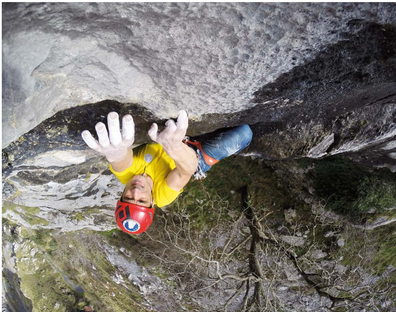
Atxarteko "Para calentar" bidean, bete-betean