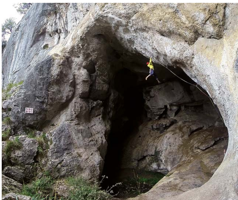
Baltzolako "Nanai" bidean

izanik teknika berezia behar izateaz gain egun guztiak ez direla aproposak izango bertan jarduteko sortzen den kondentsazioa dela medio.