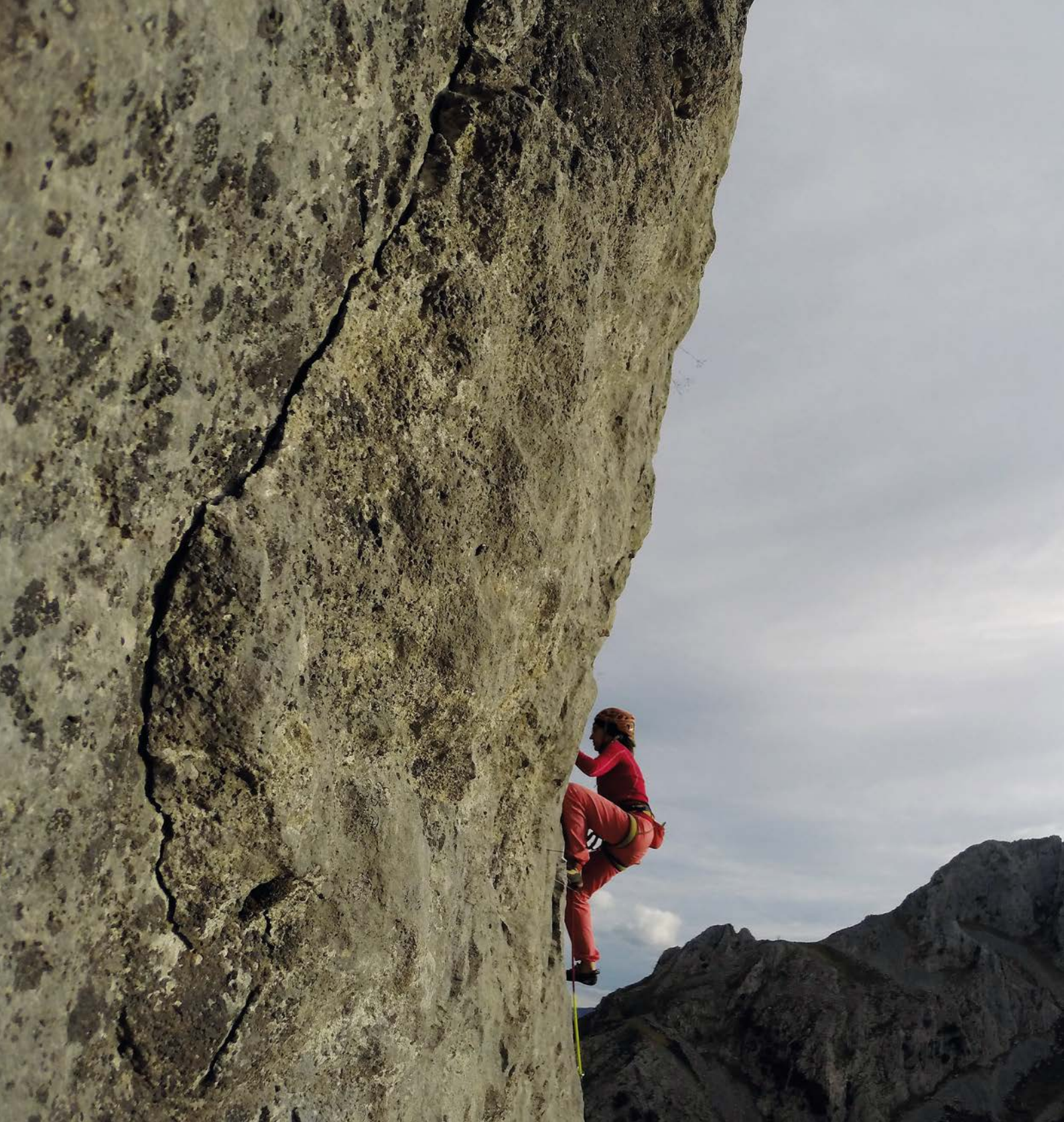
Atxarteko "Clytemnestra" bide ikusgarria