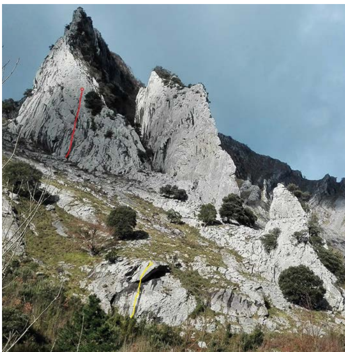
Urresteiko "Clytemnestra" (gorriz) eta "Azumi" proiektua (horiz)

ez du askorik lagunduko bide honetan. Bata bestearen atzetik doazen bloke multzo gogor batek helduleku hobeak eskaintzen dizkigun zatira eramango gaitu, pisuaren aldaketekin etengabe jolas egitera behartuz. Zailtasun maila konstante mantentzen duen egundoko bidea da, eskalatzaileari daukan onena ematea eskatuko diona. Expresak jarrita egon ohi diren arren biziki gomendatzen da norberak bereak erabiltzea zinta zaharkituen apurketak ekiditeko.