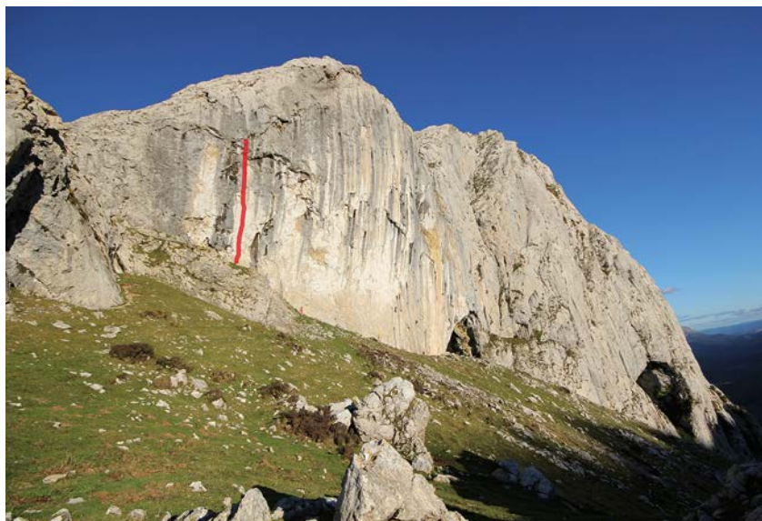
Mugarrrako "Tormenta de verano" bidearen krokisa

Tormenta de verano Mugarrrako 8a zailtasun mailako bide paregabea da. Bertikaltasuna gainditzen duen horma honetan indarra gogoz erabiltzea eskatuko duten pausoak agertuko dira, erregeleta onak mota guztietako heldulekuekin tartekatuz. Eskuilatxo bat eramatea gomendagarria da beheko zatian liken zuria sortzen delako, nahiz eta ez duen igoera oztopatzen. Ondo begiratuta atsedean-lekua ere aurkitu ahal izango dugu besaurrean pilatutako laktatoa arintzeko. Gozatzeko bidea, edozein kasutan.