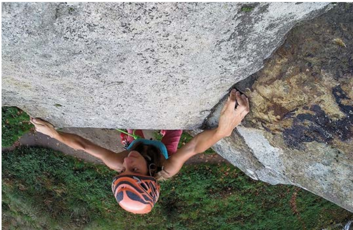
Urduliz sektoreko "Urkatt" bidean