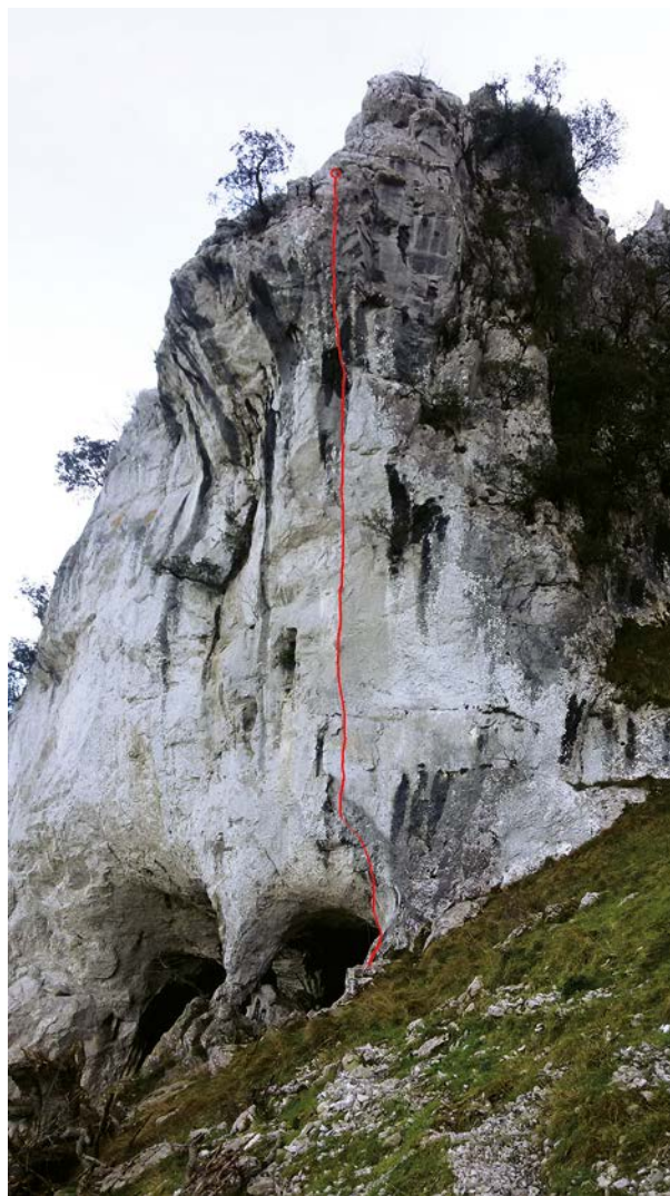
"Peter North" bidearen krokisa

Pyrenaica aldizkariko ale hau argitaratzerako eta eguraldiak hala baimentzen badu Atxkobako (ipar isurialdea) bide hau ber-ekipatuta egongo da jada. Oraingoz proiektu soila da eta ez gara zailtasun maila bat proposatzera ausartzen baina ziu-