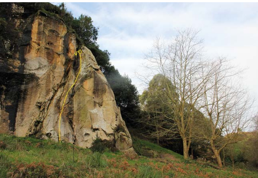
"Urkatt" bidea, Urdulizen

bide bat baizik. Hasiera korapilatsua du eta gero eutsi egin behar zaio. Adi, hala ere, erne ibili ezean ezustekoa eraman baitezake eskalatzaileak katera heldu aurretik... Bi eta hiru atzamarretarako heldulekuak txandakatuz doaz alderantzizko helduleku eta helduleku zapalekin, elkarketa dibertigarri bat osatuz bertikaltasunaz haratago doan bide honetan disfrutatzeko.