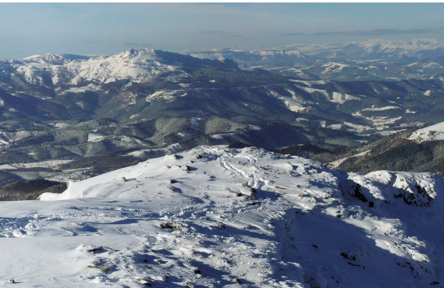
Tontorreko postontzia, atzean Gorbea eta Lekanda zaindari dituela

etenik gabe eta kontuan izanda arrastoa zabaldu gabe dagoela, nekea gero eta gehiago nozitzen dugu gure hanketan. Ipar isuria izanik gerizpean jarraitzen dugu, baina bailaran eguzkia nagusi da. Bide batez, geldialditxoak aprobetxatzen ditugu hauspoa berreskuratzen dugun bitartean inguruan dugun paisaia ikusgarriari argazkiak ateratzeko. Gutxika metroak kendu dizkiogu mendiari, eta jadanik Frailea orratzari parez pare begiratu ahal izan diogu, hau da, mila metroko altuera muga igaro berri dugu.