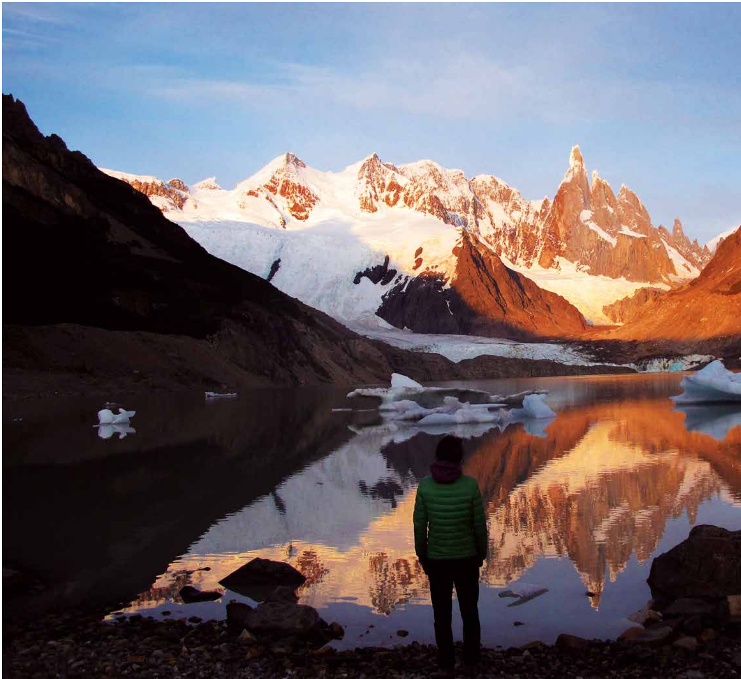
Cerro Torreren ekialdeko aurpegia, egunsentian

Jakina, guk ere aprobetxatuko dugu aukera: sei egunetan emango diogu mendigune osoari itzulia, eta mendebaldeko aurpegiak ezagutuko ditugu. Horretarako, hegoaldeko izotz-lautada handian sartu beharko dugu, Campo de Hielo Patagónico Sur deiturikoan. Munduko hirugarren izotz-plaka handiena da, Antartika eta Groenlandiaren atzetik.