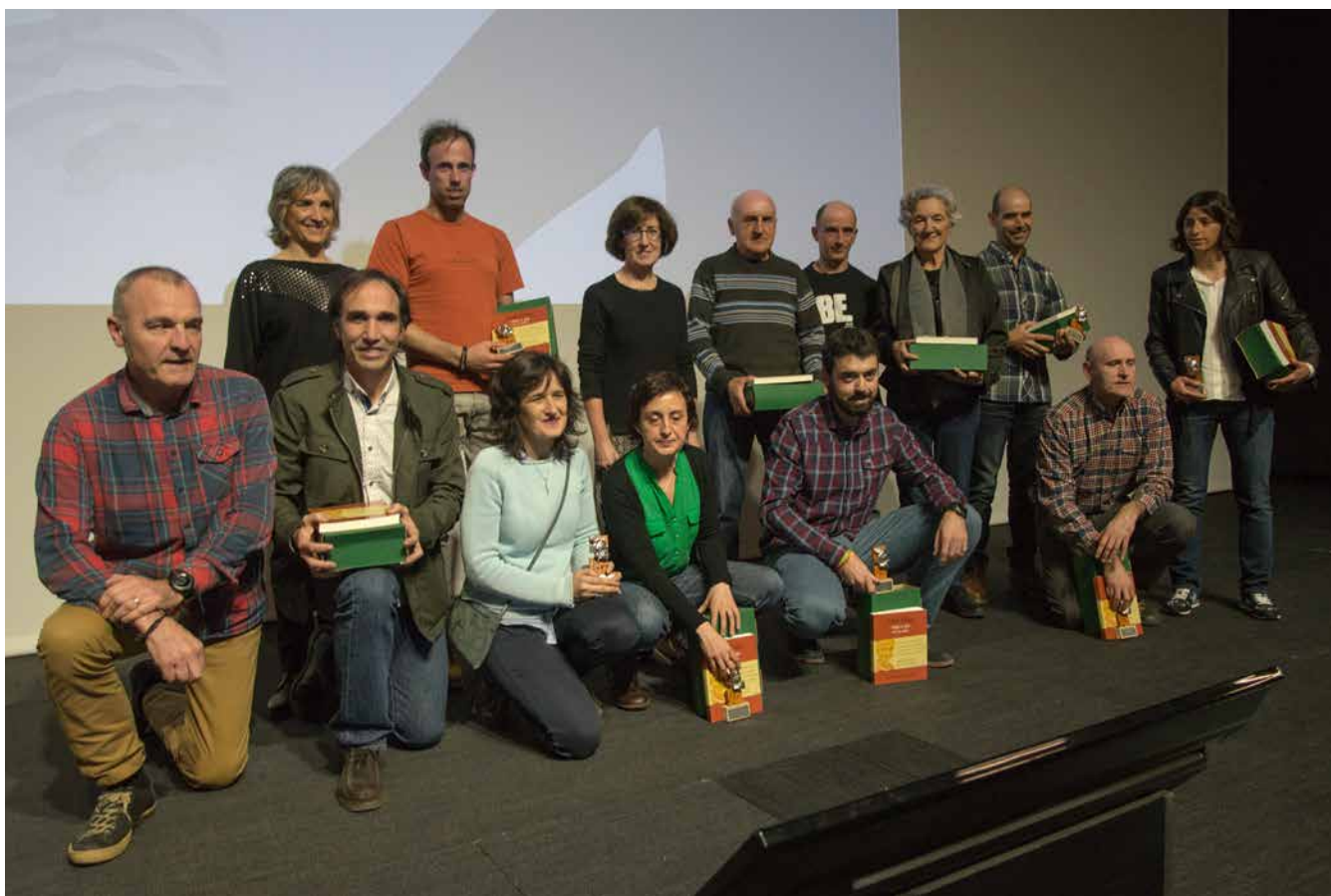
Premios Pyrenaica 2016.

Finalizó la gala con la proyección de Dodo's Delight película cedida por el Bilbao Mendi Film Festival, ganadora del Eguzkilore a la Mejor Película de Deporte y Aventura en la pasada edición.