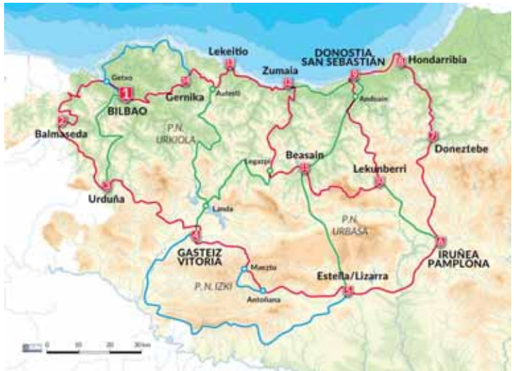
■ Euskadi en BTT

visita a pueblos y lugares de interés turístico. De esta forma, la primera resultará ser una ruta exigente, con mayores desniveles, ideal para los que disfrutan de los senderos técnicos y la adrenalina. La segunda, en cambio, resultará apta para un mayor abanico de público, será más suave y hará gozar a los que aman la cultura y disfrutan admirando con detenimiento todo lo que les rodea.