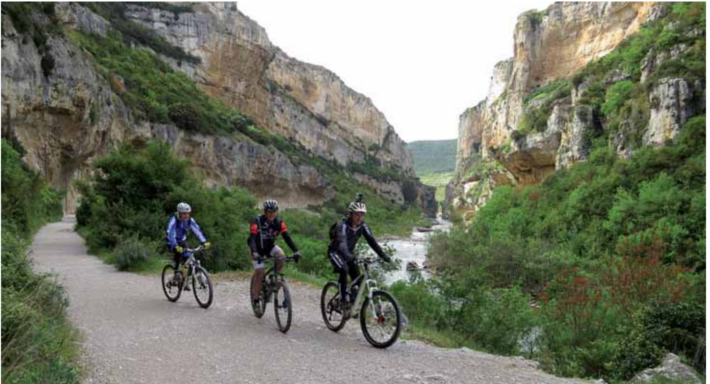
■ Irunberriko arroila

conocida sierra como lo es la de Andia. Nuestro siguiente enlace es Urbasa, que nos sorprenderá con sus verdes hayedos y misteriosas cuevas en el camino al Balcón de Pilatos. Por Opakua llegaremos a Erroitegi, donde se encuentra el descenso del barranco de Igoroin. Y así llegaremos a Maeztu, que nos dará la bienvenida al Parque Natural de Izki. Nos adentramos en el corazón del mayor marojal del Estado, recorriendo algunos de los senderos más divertidos en busca de la Sierra de Cantabria o Toloño.