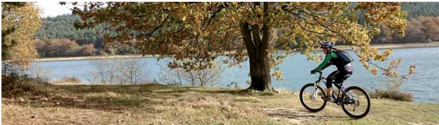
■ Embalse de Albina