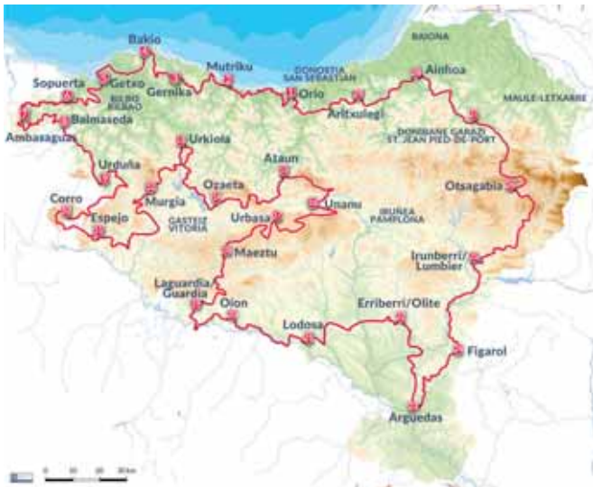
■ Trans EH ibilbideak