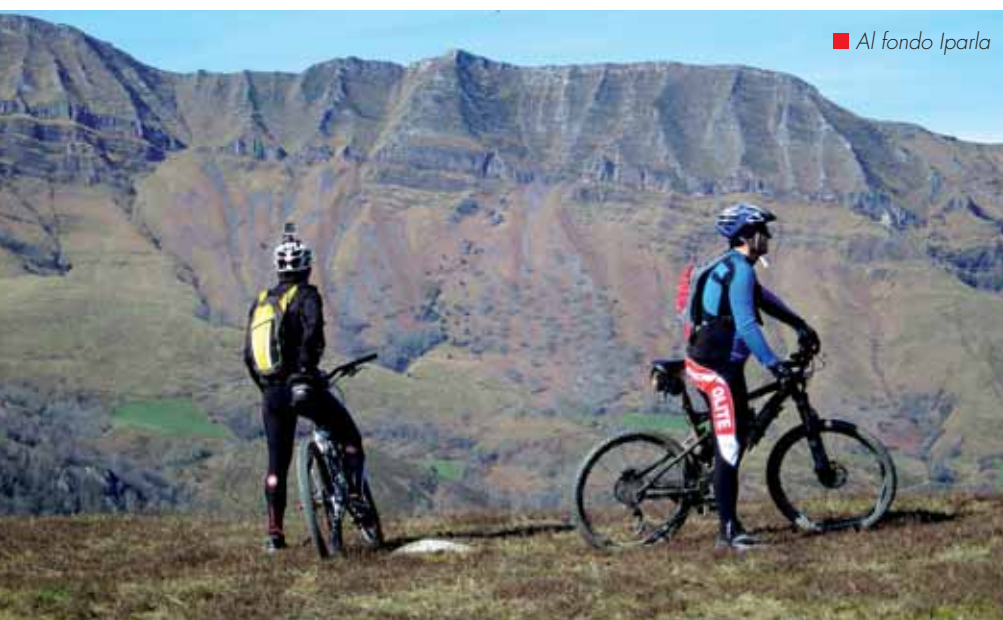
■ Al fondo Iparla