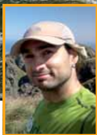
Texto y fotos Iván Ruiz "Rota"

Iván Ruiz "Rota" (Amurrio, 1982). Disfruta de la montaña, ya sea andando, en bici, trepando o en condiciones invernales. Sobre todo en las montañas de Euskal Herria, aunque también por el norte del Estado (Pirineos, Picos de Europa, Sistema Ibérico, Montaña Palentina, Gredos...). Recientemente ha terminado los centenarios alaveses. Participa activamente en webs como Mendiak.net e Ibilbideak o en su blog (elultimodestino.wordpress.com). Socio de los clubes de Amurrio Mendiko Lagunak y Kuskumendi MBT. Pertenecer al equipo de redacción de Pyrenaica.