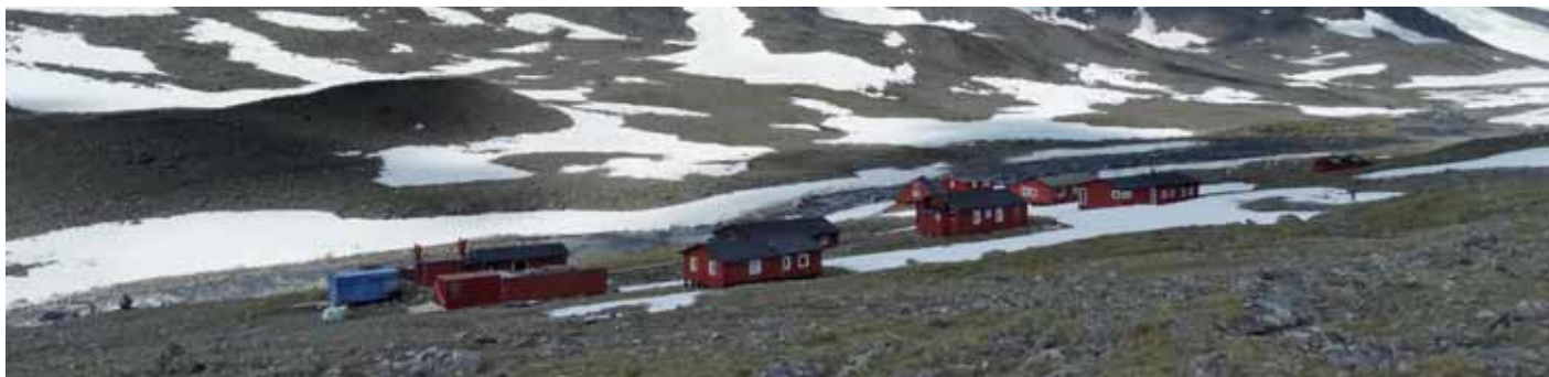
■ Tarfala ikerketa zentrua

Ohikoa den moduan, Sälka aterpeko zaindarien oso harrera atsegina egiten didate, ahabi zukua eskaini eta sukalde eta saunaren funtzionamendua pazientzia handiz azaldu didate. Sauna probatzea erabaki dut. Ohitura ez duen batentzat bero gehiegi egiten du denbora luzez irauteko, baina berogailutik ateratako ur beroa eta erreka ur hotza kuboetan nahasiz bainu bat hartu dut. Suediarrak, saunatik irten