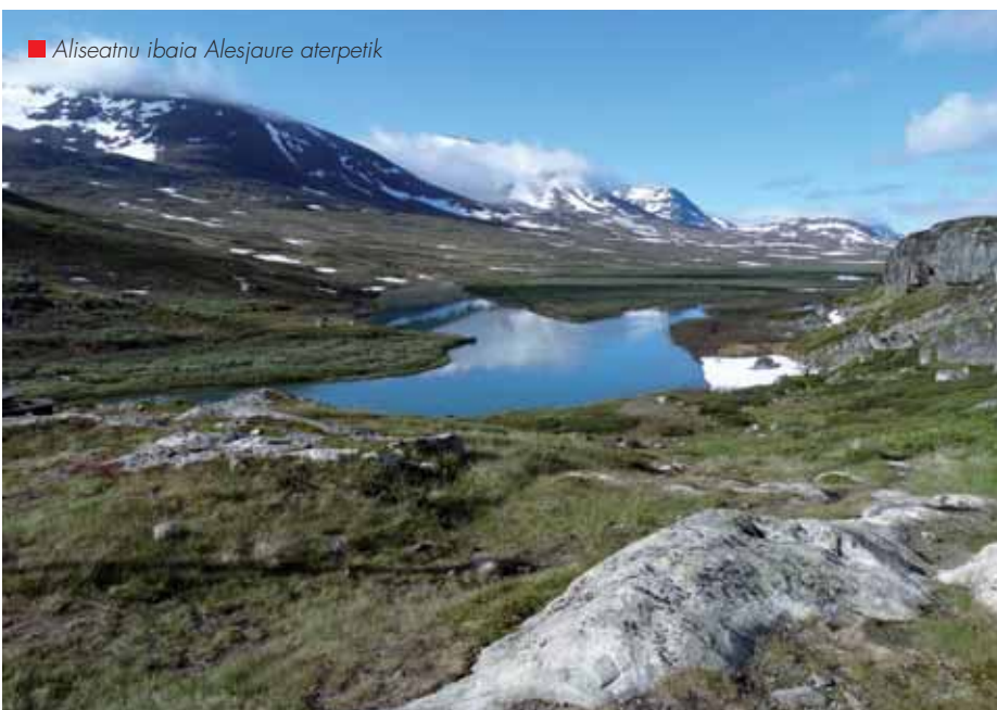
■ Aliseatnu ibaia Alesjaure aterpetik

Ez dago ez ur korronterik ez argirik. Ura, aterpearen arabera kanpoan kokatutako bidoi batzuetatik edo ibaitik bertatik hartu behar da. Ibaitek ura hartzeko leku konkretu bat markatzen da. Kontuz, beraz, non egiten den pixa! Beti ura hartzen den lekutik behera. Ur korronterik ez dagoenez, ez dago dutxarrik, baina aterpe guztietan sauna hartzeko eraikin bat dago.