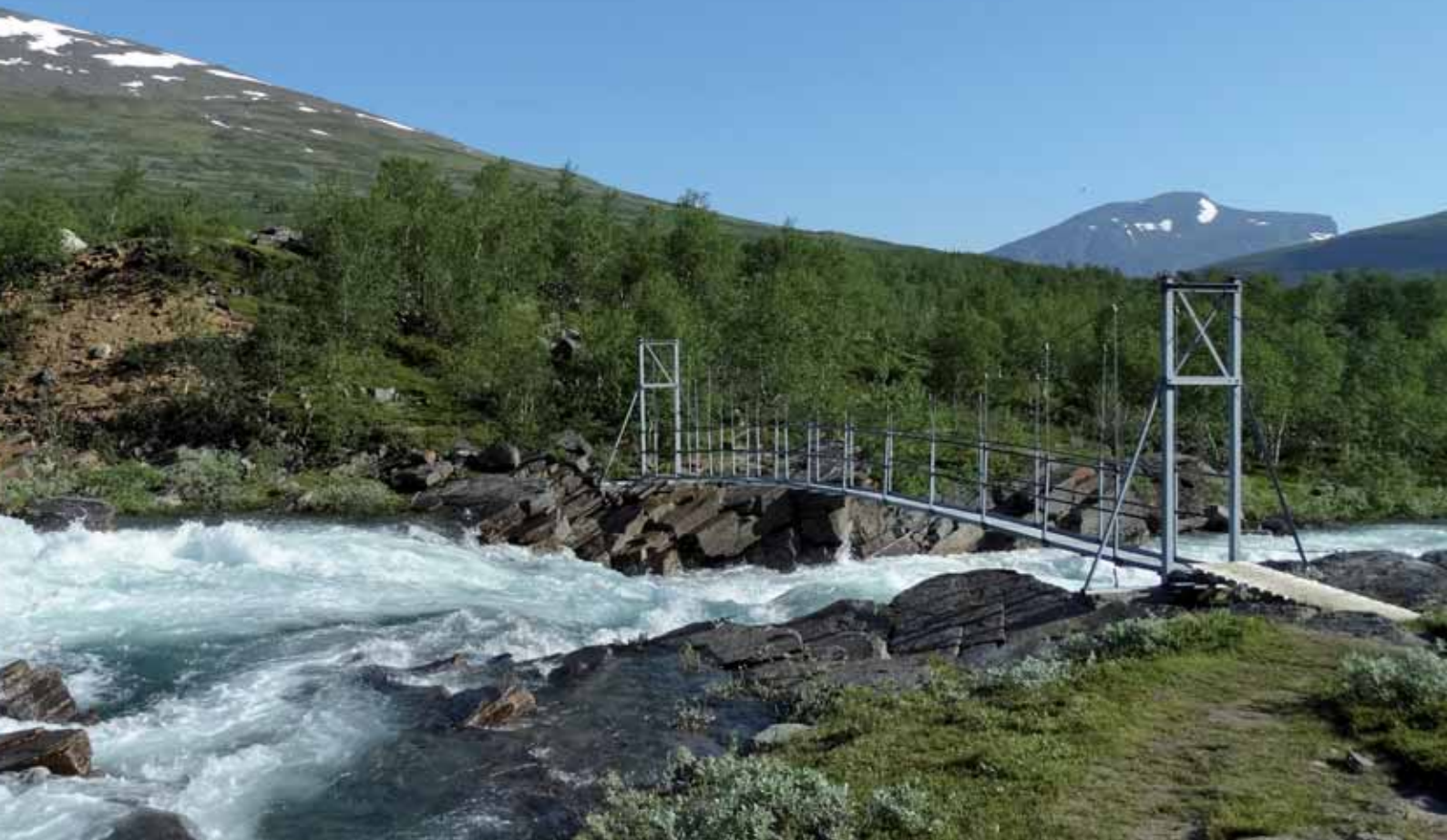
■ Zazpigarren etapan Sjaunja erreserba naturaleko paisaia.

mendizaleak elkartzen dira hemen, baina nagusiki suediarrek. Deigarria da suediar askok daramaten motxilaren tamaina. Ondo betetako 80 litroko motxilak dira nagusi eta batzuetan nork motxilarik astunena eraman lehiatzen ari direla dirudi. Hala ere, mendizaletasunaren azken joerak ere hona heldu dira eta bada trekkinga 30 litroko motxilekin eta korrika egiten duen jendea ere.