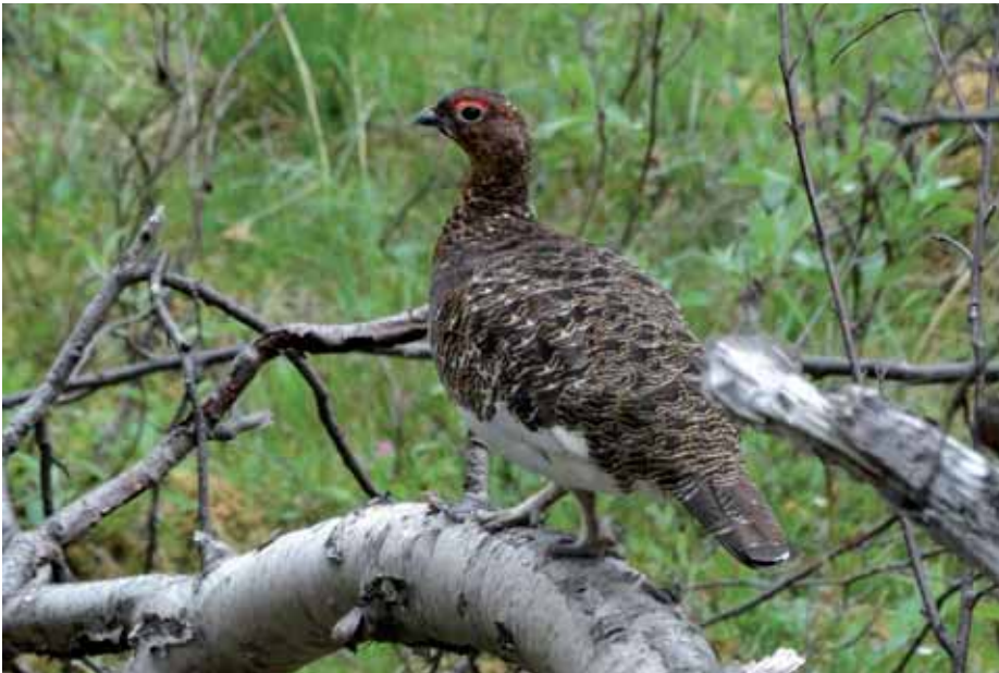
■ Elur eperra Abisko parke nazionalen

hasteko irrikan nago. Museoari begirada azkar bat eman ondoren, bide hasiera markatzen duen arkupe azpitik pasa eta trekkinga hasi dut. Arratsaldeko 15:30ak dira eta 14 kilometro egin behar ditut Abiskojaure aterpera iristeko.