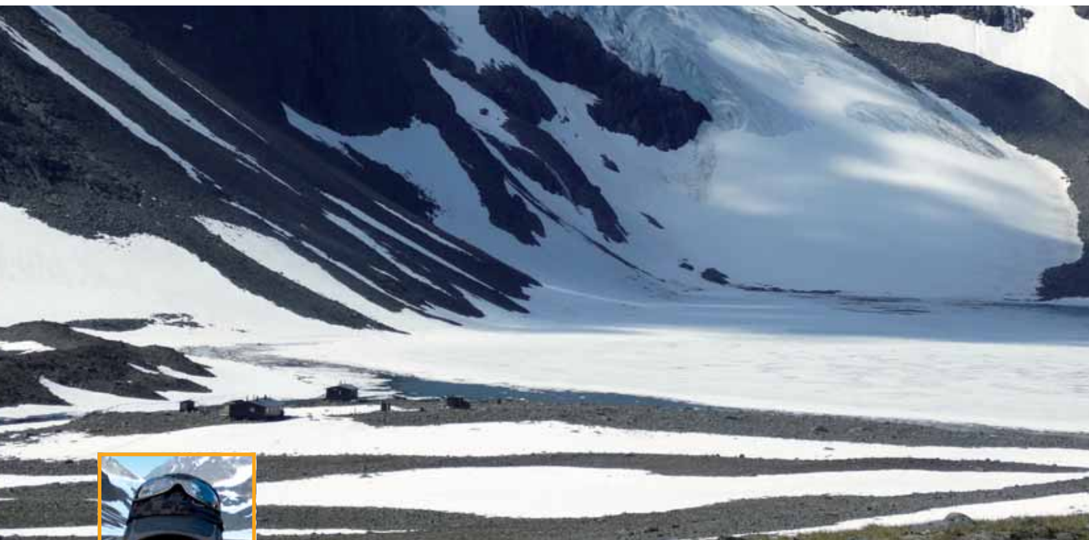
■ Tarfala aterpea