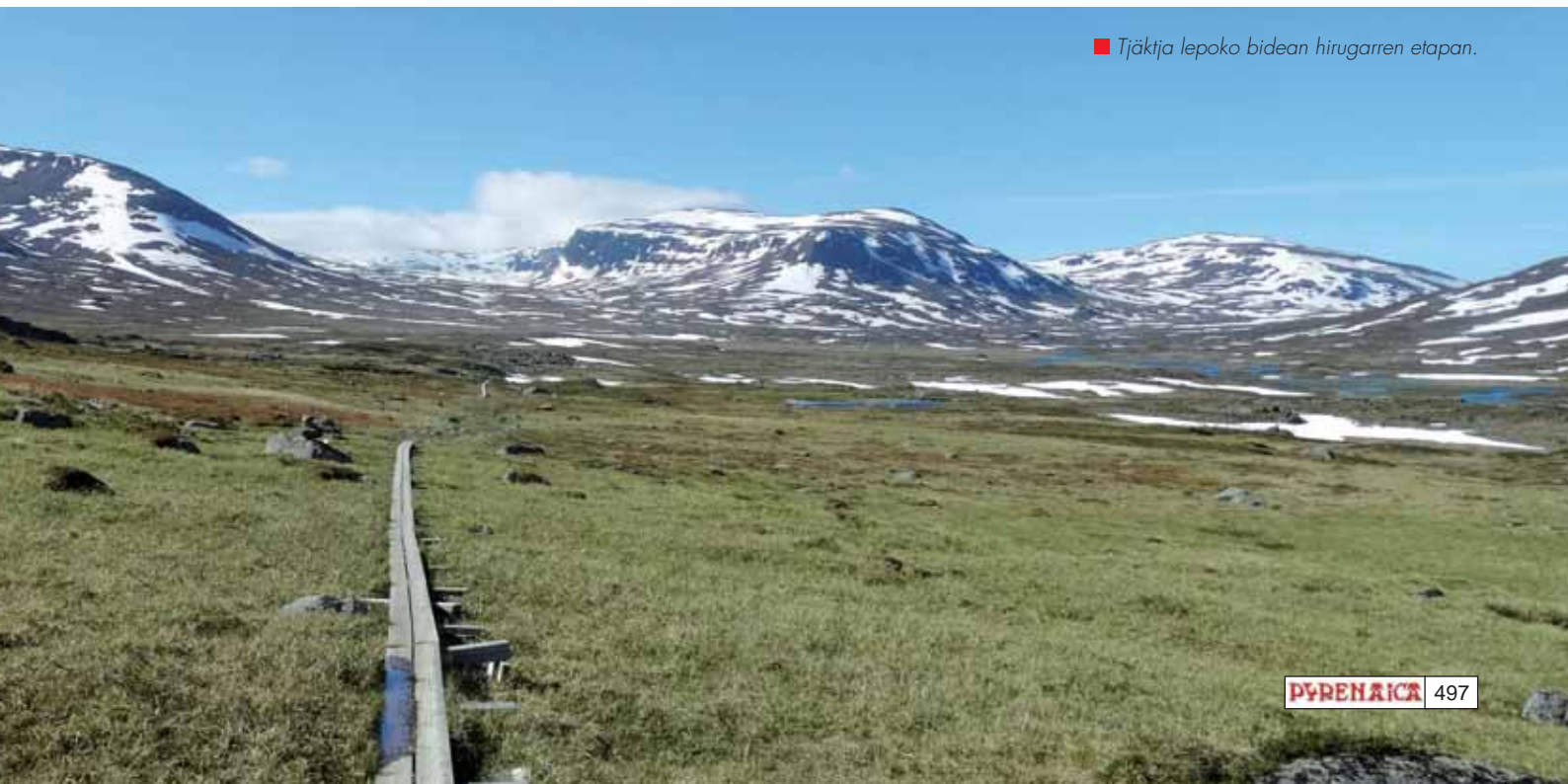
■ Tjåktja lepoko bidean hirugarren etapan.