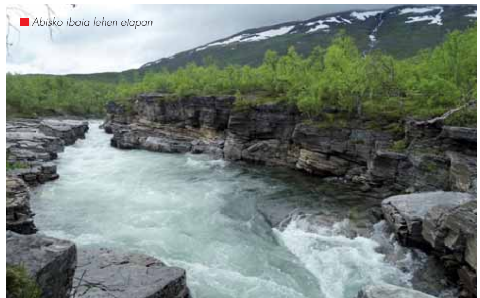
■ Abisko ibaia lehen etapan

Kungsleden bidea Abisko guneko turistikoan hasten da, Kirumatik ordu eta erdira Norvegiako bidean. Bidaia hau trenez egin daiteke, baina nik autobusez egin dut. Autobuseko kreditu txartela pasatzeko makinak funtzionatzen ez duenez, ez diote inori txartelik kobratu, ezta esku-dirutan ordaintzera gindoazeno. Abiskon turismo bulegoko hotela eta aterpe bat daude eta parke nazionalaren museo eta informazio bulegoa. Leku interesgarria da, baina bidea