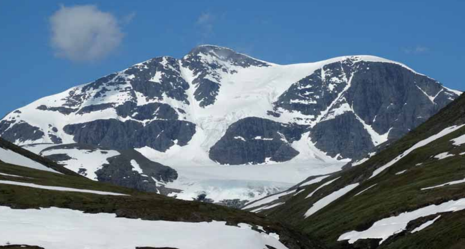
■ Sealgga mendia (1865 metro)

Laino artean laku luze batera heldu naiz eta honen amaieran kokatzen da Alesjaure aterpea. Lakuaren ertzean japoniar talde bat aurkitu dut. Hamar bat dira, gehienak 60 urte gorakoak. Datozen egunetan behin baino gehiagotan aurkituko dugu elkar. Aterperako bidean oraindik zubirik gabeko bi erreka gurutzatu behar direla ohartarazi didate. Inguruko samiek txalupa zerbitzu bat eskaintzen dute aterpera iristeko eta baldintzak ikusita, hura hartzea erabaki dute. Dena den, gure aurretik oinez joatea erabaki duen jendea badagoela esan didate eta bidea jarraitzea erabaki dut. Handik gutxira, suediar batekin egin dut topo. Hurrengo errekan ura belauneraino iristen dela esan dit, baina dagoeneko botak bustiak ditugunez axola ez duela eta aterpean lehortuko garela dio. Zubi gabeko erreka pare bat gaingitu ondoren, Alesjaurera iritsi naiz azkenean. Etapa erraza izan beharko lukeen hau, pentsatutakoa baino gogorragoa bilakatu da. Blai iritsi naiz. Aterpea bi laku artean dagoen muino batean kokatzen da.