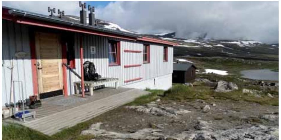
■ Alesjaure aterpeko eraikinetako bat

Hurrengo goizean euria ari du. 8º C-ko tenperatura. 20 kilometro dira Alesjaure aterperaino eta nagia pixka bat ematen du