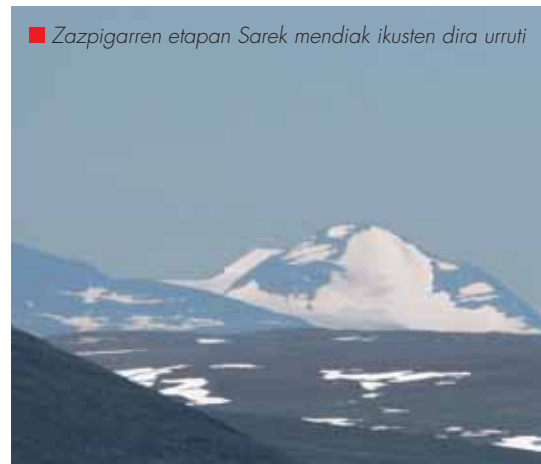
■ Zazpigarren etapan Sarek mendiak ikusten dira urruti

Behetik ikusitako gailurrerako norabidea hartu dut. Aldapa malkartsua da eta harri bloke handiek deserosoa bihurtu dute. Azkenean, gailurra markatzen duten harri pilora iritsi naiz. Hunkigarria da hemen bakarrik egotea. Han behean, urruti, ikerketa zentroa eta Tärfa aterpea ikusi ditut baina, horrez gain ez dago gizakiaren arrastorik. Gero, aterpean mapa begiratuta, Tarfalapakse (1813 m) igo dudala jakin dut, Darfalcohka mendiaren bigarren mailako tontorretako bat. Tentu handiz jaitsiera