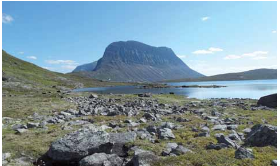
■ Kaitumjaure aterperako bidean, seigarren etapan.

Sälka aterpe atsegina atzean utzi eta laster bidaiako lehen glaziarra azaldu da, Sealggaglaciären glaziarra, 1865 metroko mendiaren magalean. Sälka-tik bi ordura aurkitu dut bidegurutzera. Aurrera, hegoaldera, Singi aterpea eta Kugsleden bidearen jarraipena, ekialdera, berriz, Kebnekaise aterpeko bide aldapatsua. Azken bi egunetan jarraitu dudana harana alde batera utzi eta ezkerreko bidea hartu dut. Ibai ondolik urrundu behar dudanez, ura hartu dut badaezpada bide alboko erreka batean. Dena den, inguru hauetan ura ez da arazoa izaten gehienetan, haranak errekez josita daude eta badago kantiploraren orde z potoa besterik ez