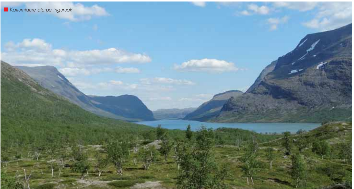
■ Kaitumjaure aterpe inguruak

mendi garaien artean. Arroila amaitzean, harana zabalduta eta iparralderantz Kebnekaise mendi multzoa agertu da. Hemendik ez da Kebnekaise gailurra ikusten baina bai 1662 metrotako Duolbagorni mendi ederra. Kebnekaise luxuzko aterpea da, mountain station erakoa eta zerbitzu guztiak eskaintzen ditu: dutxa, iturriak, komun normalak, jatetxea, wiffia tarteka, kañeroko garagardoa, mendi materiala alokatzeko aukera, etab. Bidaia osoko aterpe jendetsu eta zalapartatsua da. Nikkaluokta herritik ordu gutxitan iritsi daiteke hona eta jende asko etortzen da Kebnekaise igotzera edo naturaz goatzera. Estatubatuarrak, alemaniarrek, japoniarrek, leku askotako