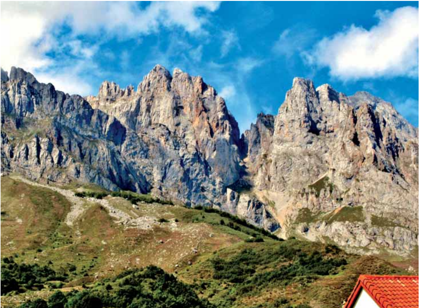
■ Torre Bermeja desde Posada de Valdeón

collado se alcanza rápidamente el viejo refugio y una fuente. Se avanza ahora por el "Camino del Burro", 2 km de camino fácil hacia el sur. Finalizamos en el Collado del Burro, el punto más alto de la ruta.