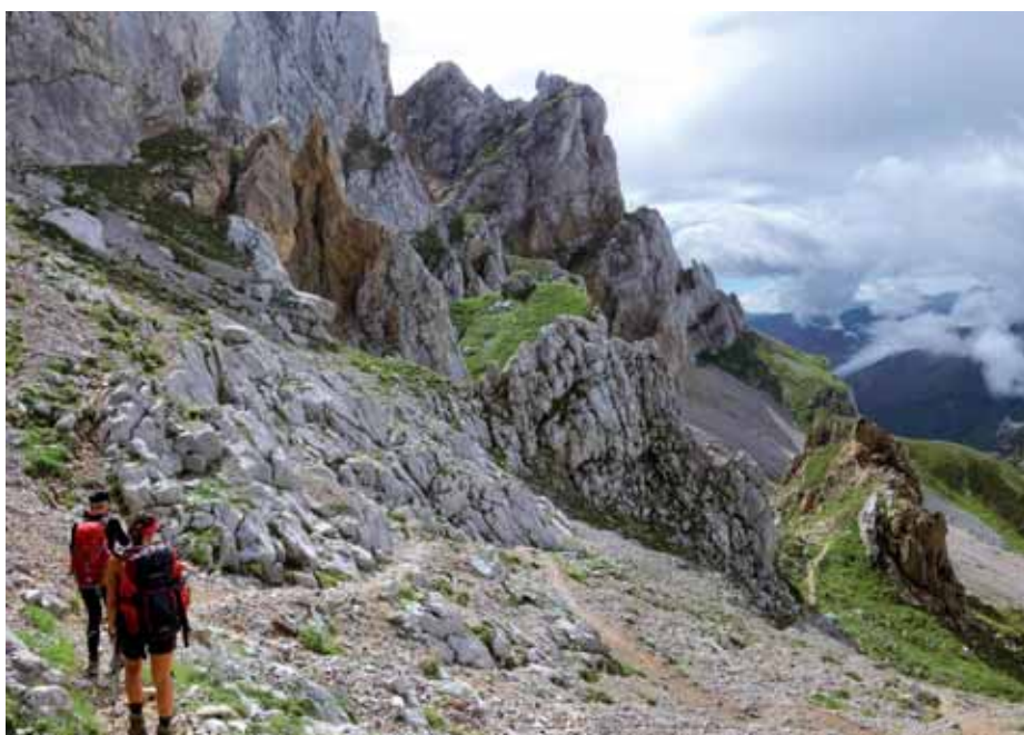
■ En la travesía de la tercera etapa

sendas del ganado nos elevamos (SW) a la depresión del escarpado cordal que aparece a nuestra derecha (W), progresando por su herboso lomo (SSE) hasta el Pico Jario (1919 m) (1,30 h). A continuación caminamos por el cresterío para ascender a la Pica Samaya (1859 m) y descender a la Collada de Dobres (1555 m), donde enlazamos con la senda que va desde el refugio de Vegabaño a Posada de Valdeón (PR-12).