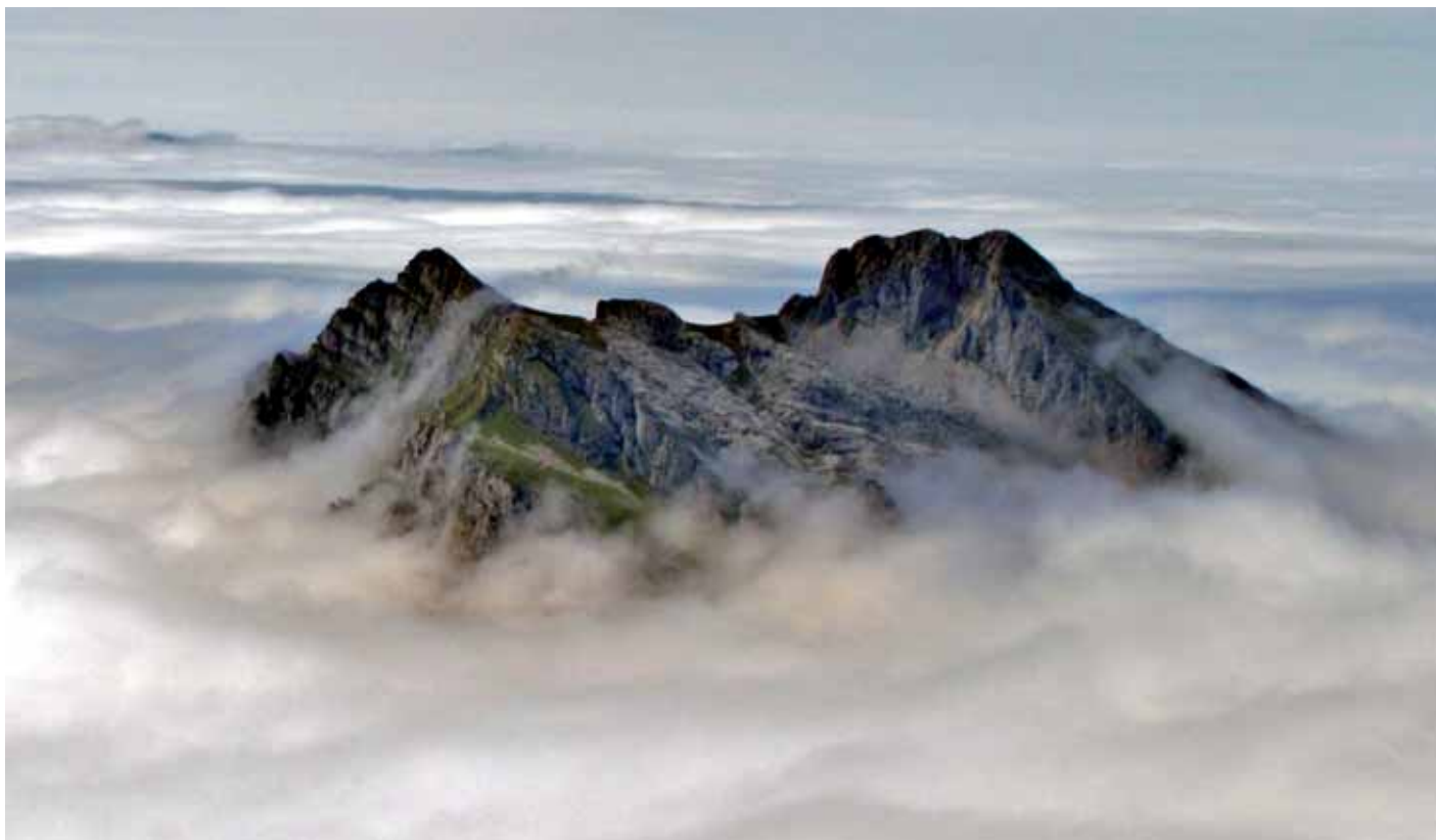
■ Canto Cabronero en un mar de nubes

proximidades de la Majada de Argoya. Aunque es posible acceder a Soto de Valdeón ascendiendo por la izquierda en dirección a Vega de Llos, nos decantamos por un descenso directo tomando la pista hacia la derecha. Tras 1,5 km se franquea una puerta, que debe dejarse cerrada, y en pocos metros se llega a Caldevilla de Valdeón. La mejor opción para evitar la carretera es continuar en la dirección que llevamos. Así se alcanza y atraviesa Soto de Valdeón. Tan sólo resta