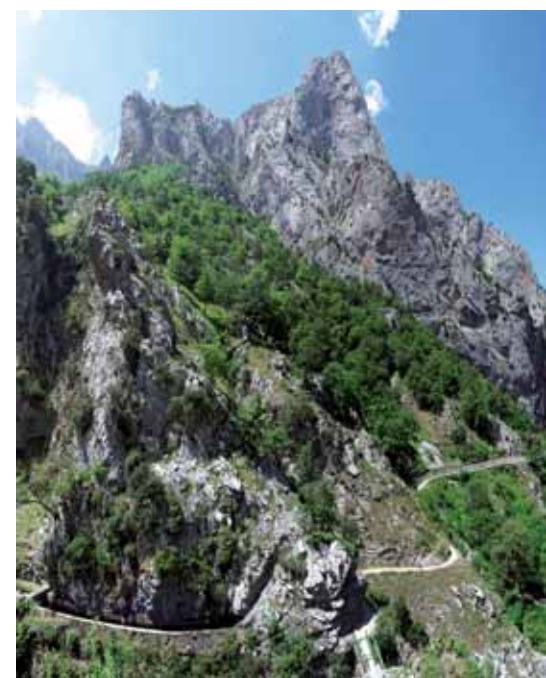
■ Senda del Cares y Canal de Trea

El pico Jultayu, próximo a la majada de Vega de Ario, en el corazón de los Picos de Europa, es uno de los balcones más impresionantes de los Picos de Europa. Desde su cima se ven, casi