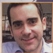
Texto y fotos David Maeso

E N la pequeña república caucásica de Armenia, tierra de volcanes, son varias las cumbres que nos facilitan la aclimatación, para acometer así con éxito el vecino Kazbek, uno de los cincómiles georgianos.