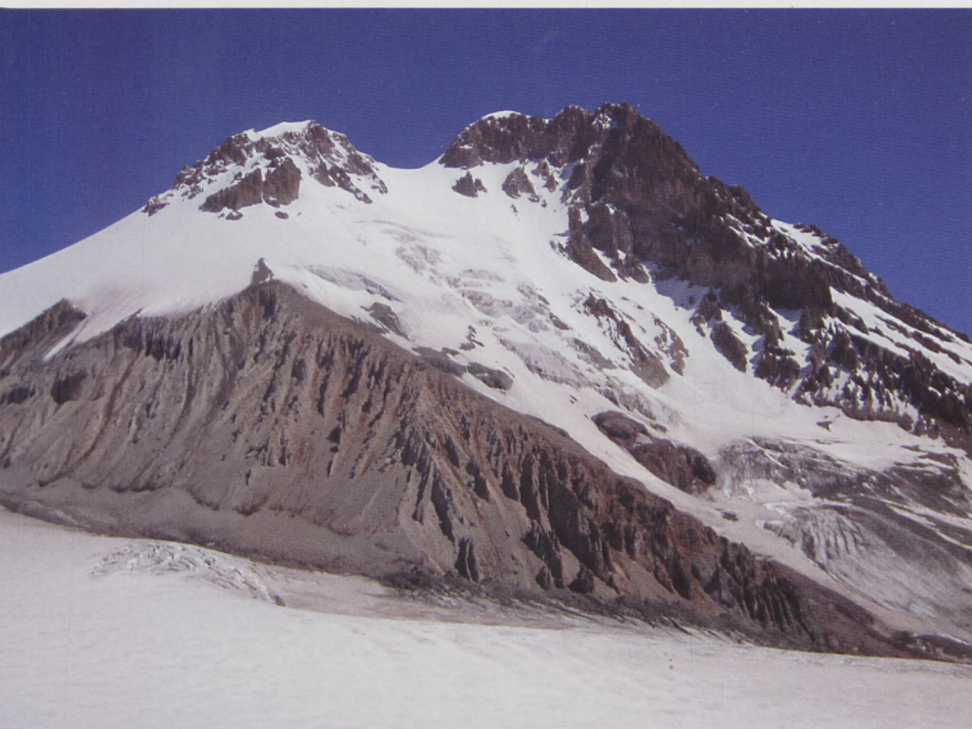
■ Macizo del Kazbek

La ascensión al Kazbek no es técnica pero conlleva un desnivel considerable, aproximadamente unos 3200 m. La ruta comienza atravesando el poblado de Gergeti, punto de acceso a la famosa iglesia de Tsminda Sameba (de obligada visita) a través de una pista forestal. Desde aquí se asciende primero a un collado situado a medio camino del Refugio / Estación Meteorológica Betlemi (a unos 3800 m), para posteriormente cruzar el arroyo formado por el deshielo del glaciar. Se atraviesa la morrena y el glaciar evitando varias grietas, para finalmente acometer la pendiente pedregosa al refugio. Se aconseja no obstante acarrear tienda de campaña y acampar en las inmediaciones, ya que el refugio se caracteriza por guardas ebrios, suciedad y ruido.