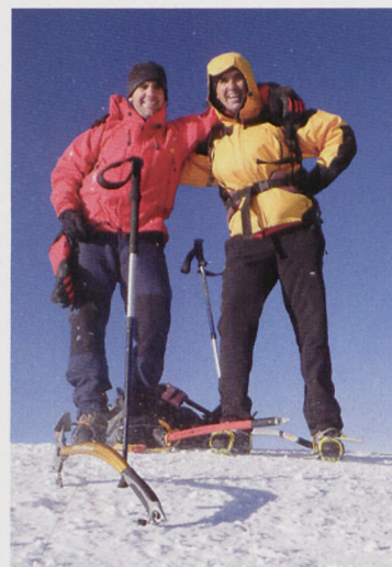
■ Cima del Kazbek, 5034m