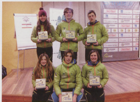
■ Los integrantes de la Euskal Selektzioa de Esquí de Montaña