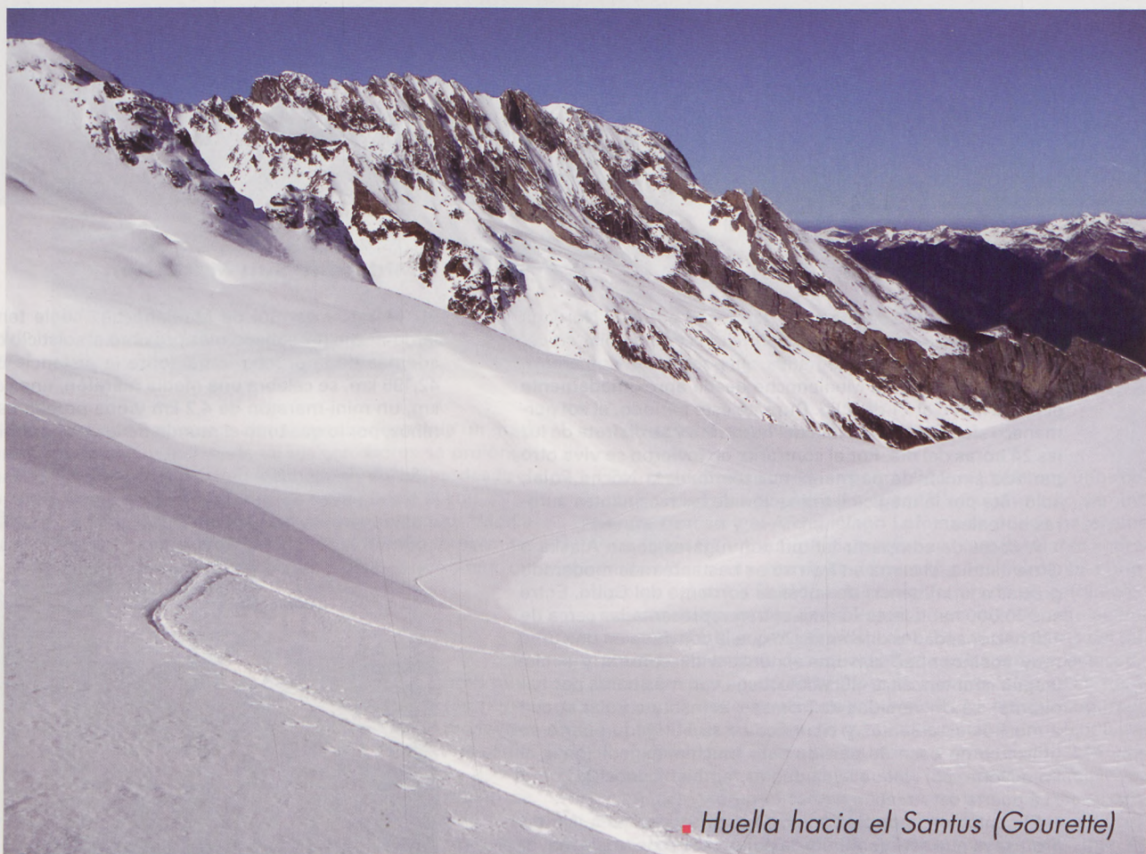
■ Huella hacia el Santus (Gourette)