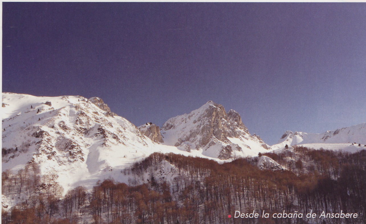
■ Desde la cabaña de Ansabere