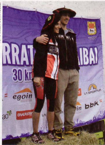
■ Campeona y campeón de Bizkaia de Carreras por Montaña