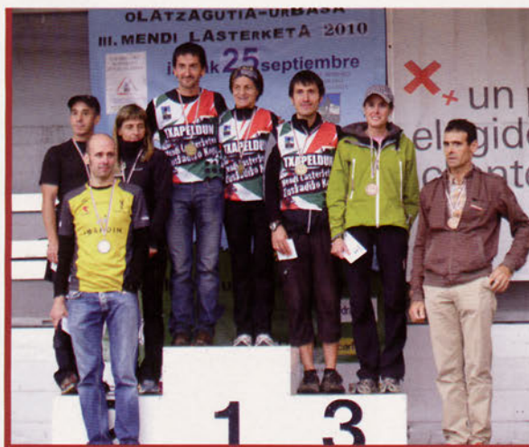
■ Todos los premiados en Olatzagutia

Bajo la excelente organización de Sutegi Mendi Taldea, el 25 de septiembre se disputó la IV Olatzagutia-Urbasa Mendi Lasterketa, 4ª y última prueba de la Copa Vasca de Carreras por Montaña 2010, que contó con 294 participantes.