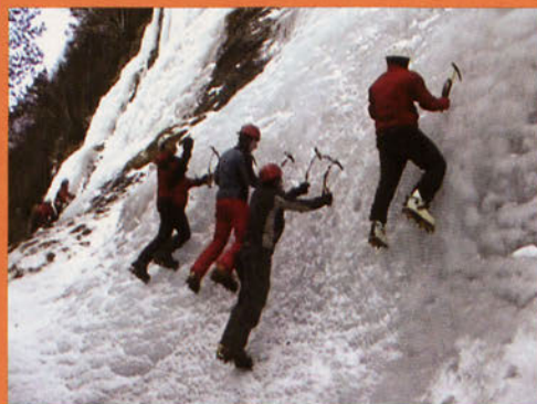
■ Curso de Escalada en Hielo de la Escuela GAM en Bielsa. Febrero 2008