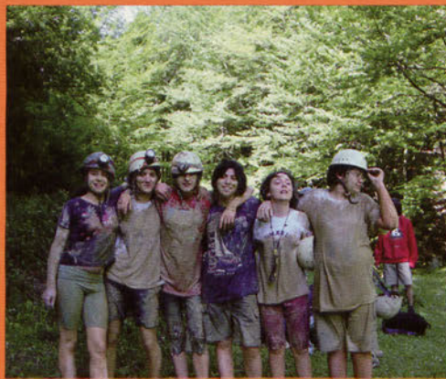
■ Escolares a la salida de una cueva en Lareo. Mayo 2006