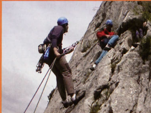
■ Curso de Escalada en Roca de la Escuela GAM en Egino. Junio 2007