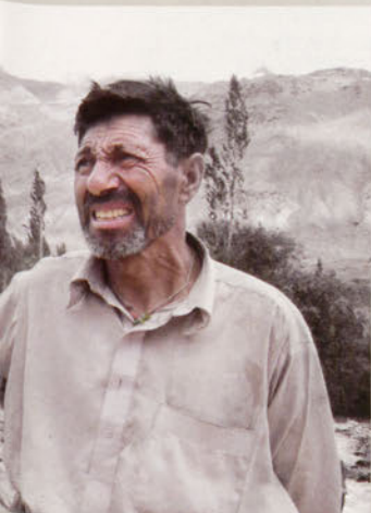
■ Las caras ante el desastre

Los baltís están acostumbrados a las adversidades, de ahí que tras la catástrofe acaecida tras las inundaciones su impulso de tirar hacia adelante no haya cejado. La ONG de montañeros Félix Baltistán Fundazioa (FBF), que lleva presente en la zona casi diez años, también ha respondido ante el desastre y trabaja en un plan de reconstrucción de las zonas afectadas.