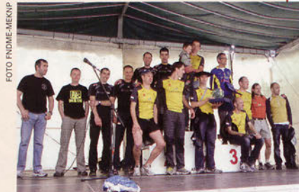
■ Campeonato de Clubes

El 24 de octubre se celebrará en Lesaka el Día de los Clubes. Beti Gazte es el club encargado de organizar este año la marcha montañera. Como viene siendo habitual, se espera que la participación llegue a las 1000 personas, más aún después del buen hacer del club lesakarra al organizar en junio la Lesakako X. Ibilaldia, incluida dentro del IIº Circuito de Marchas de Montaña de Navarra. No nos podemos olvidar del buen ambiente que tradicionalmente reina en esta celebración, tanto en la marcha mañanera, como en la posterior comida y sobremesa.