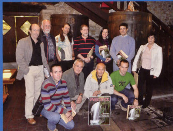
■ Colaboradores del monográfico

Al mediodía acudieron también a la cita varios de los autores del monográfico y buena parte de los fotógrafos que en él colaboraron, juntándonos en torno a una mesa en una jornada de agradable camaradería.