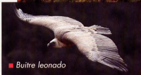
■ Buitre leonado

F OCES, hoces, cañones, cantiles, barrancos, gargantas, desfiladeros... si miráramos en un diccionario el significado de estas palabras veríamos que tienen algo en común y que todas hacen referencia a valles estrechos de paredes abruptas tallados y excavados por la acción erosiva y continuada de un río durante millones de años sobre rocas duras y permeables.