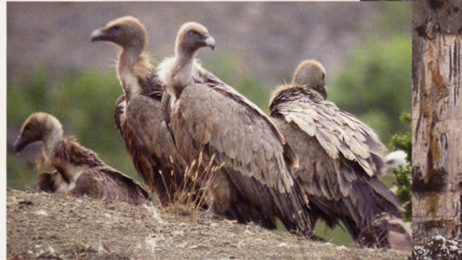
■ Buitres leonados

foz de Lumbier en el cual nos podemos topar con algún conejo, perdices y alguna liebre que arrastran tras de sí grandes rapaces y algún que otro predador que van en su busca. A partir de aquí el camino sigue ya sin pendiente para en poco tiempo comenzar a descender de forma brusca. Continuamos descendiendo pero pronto encontraremos una señal que nos desviará por una senda hacia la pista del antiguo tren de Irati. Desde aquí observaremos los alisos, fresnos, chopos y otros arbustos que forman parte de los bosques de ribera que flanquean al río Irati en su discurrir una vez pasada la foz. A partir de aquí la senda zigzaguea cerca de viñedos, olivos y almendros que rodean al vecino pueblo de Liédena.