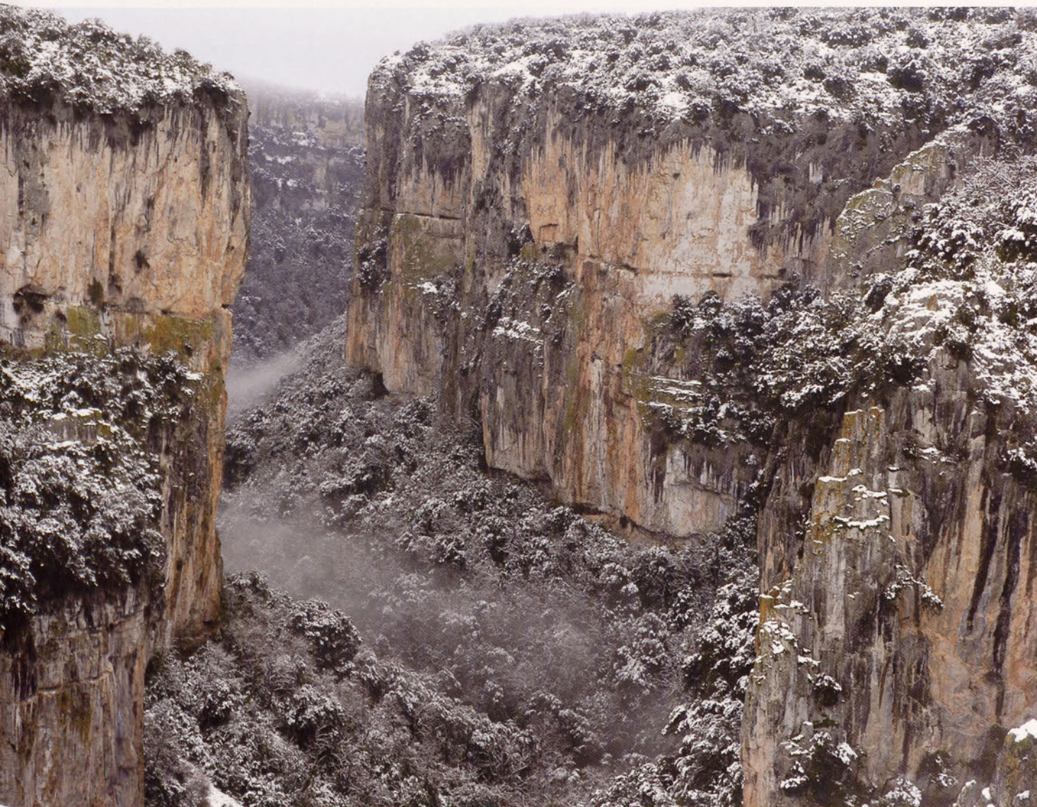
■ La foz de Arbayún vista desde el mirador

ciar la gran variedad de vida animal que envuelve a este lugar mágico. Aparte de mirar al cielo y sorprendernos con la envergadura y majestuosidad de los buitres leonados es conveniente observar el entorno del río donde mirlos acuáticos, martines pescadores, garzas y, de vez en cuando, alguna nutria se dejan ver. Para acabar con el paseo y salir de la reserva debemos cruzar otro túnel que nos acerca al punto de salida y aparcamiento y hace volver nuestra cabeza al mundo de estrés y ruidos al que estamos acostumbrados.