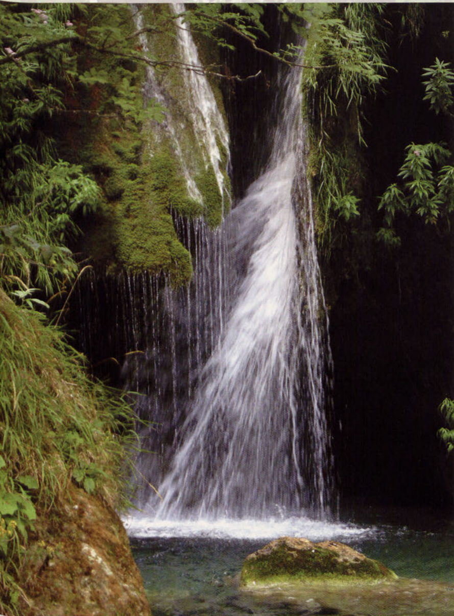
■ Cascada inicial del Nacedero