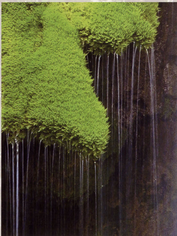
■ Detalle de los hilos de agua que caen del musgo adherido en las rocas de las cascadas próximas al nacedero