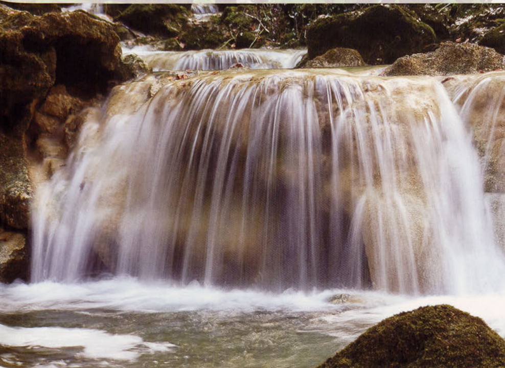
■ Detalle de una cascada bajo el puente peatonal en la parte próxima al nacedero