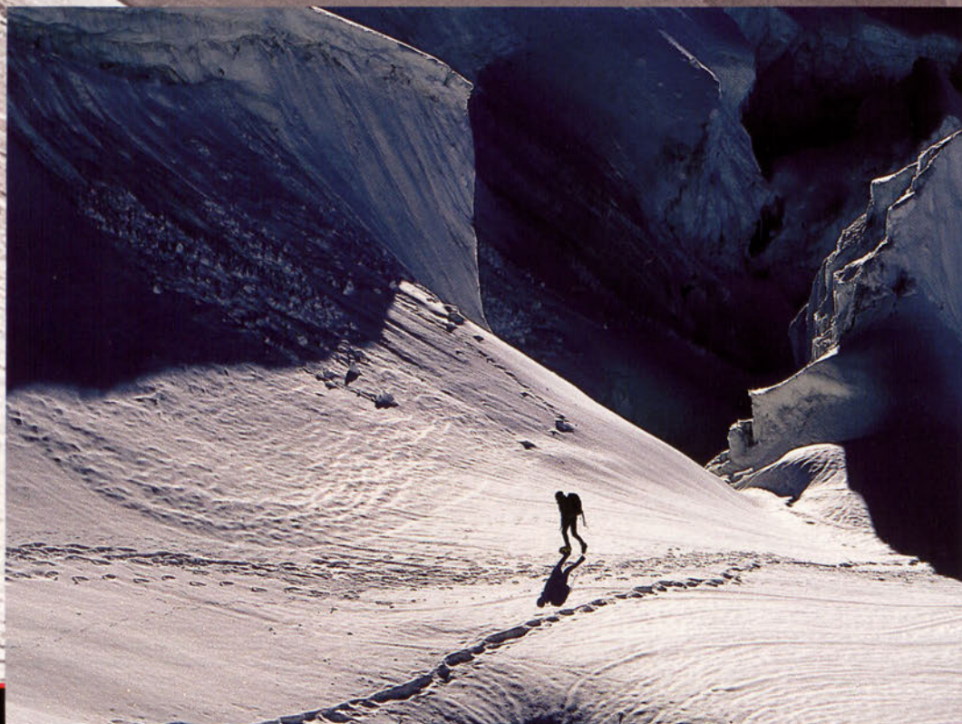
● Calor frío