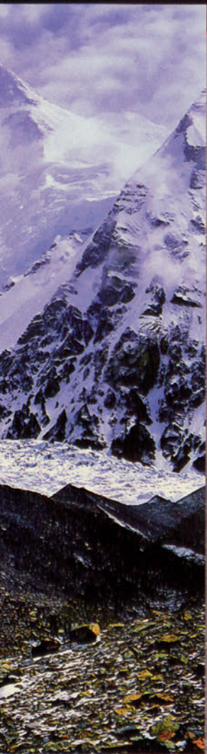
● El pico escondido