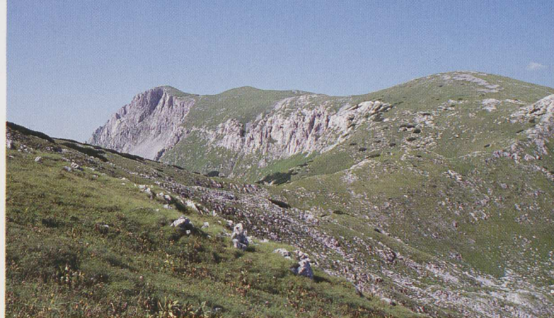
■ Cordal principal del Maglic

Estado: Bosnia y Herzegovina (BiH: Bosna i Hercegovina). Independencia: En 1992, la república de Bosnia Herzegovina declara la independencia respecto a la antigua Yugoslavia, o más bien respecto a lo que quedaba de ella: Serbia y Montenegro. Pero los bosnios de extracción serbia no lo aceptan, tomando las armas para, con el apoyo de Belgrado, conquistar el máximo territorio bosnio posible, limpiarlo étnicamente y anexionarlo a Serbia y Montenegro. Tras 3 años de guerra y genocidio, donde destacan por su crudeza los asedios de Mostar y Sarajevo, se firman los acuerdos de Dayton. En ellos, se respetan las fronteras de Bosnia Herzegovina, creándose en su interior dos entes autónomos: la Federación croata-musulmana de Bosnia Herzegovina con el 51% del territorio y la República Srpska habitada por los serbios. Capital: Sarajevo. Moneda: Marco convertible (1 € = 2 KM). El euro es ampliamente aceptado. Población: 4 millones aproximadamente. Religión: El 42% de la población es musulmana, el 37% es cristiana ortodoxa (serbios) y el 15% católica (croatas). Composición étnica: Los tres grupos religiosos pertenecen a una misma etnia de origen mayoritariamente eslavo, siendo los musulmanes los descendientes de quienes se convirtieron al islam durante la ocupación turca.