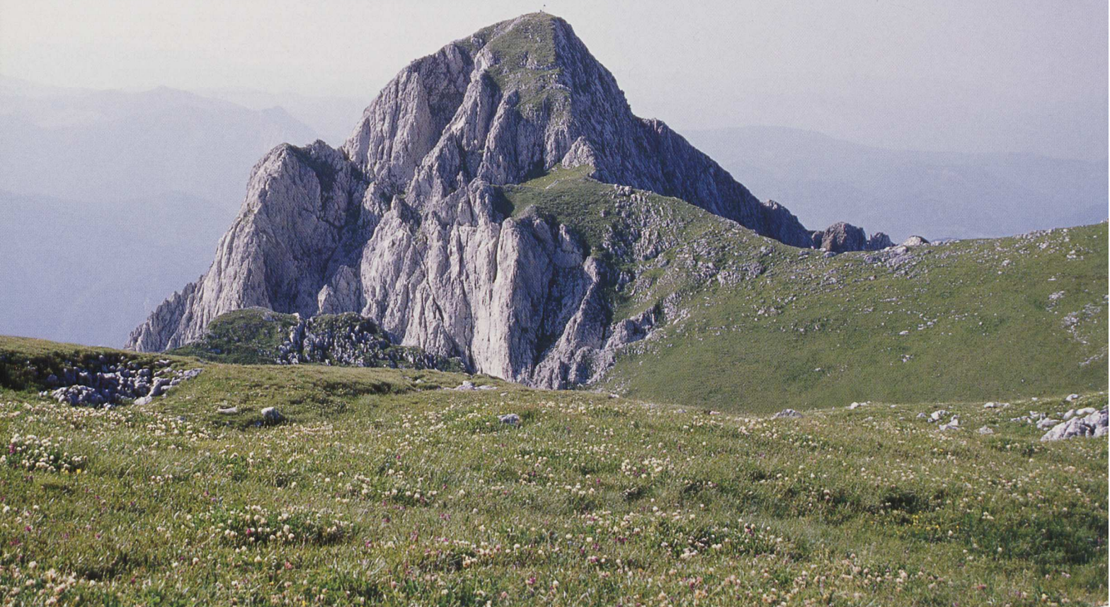
■ Pirámide cimera del Maglic

cha y, hacia el sur, alcanzar el cordal principal. De nuevo a la derecha (W), proseguimos sin más dificultad hasta la cumbre del Volujak (2346 m / 4 h).