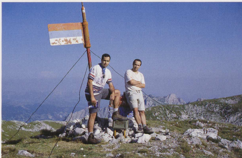
■ Maglic (2386 m), con la bandera serbia sobre la cima

tuvo tiempo también para ascender a todas las cimas con altitud superior a los 2000 m, a pesar de la entonces complicada situación del país. Unos meses más tarde, en agosto de 2005, tendríamos la oportunidad de adquirir in situ varios ejemplares de su recién publicada guía Forgotten Beauty . □