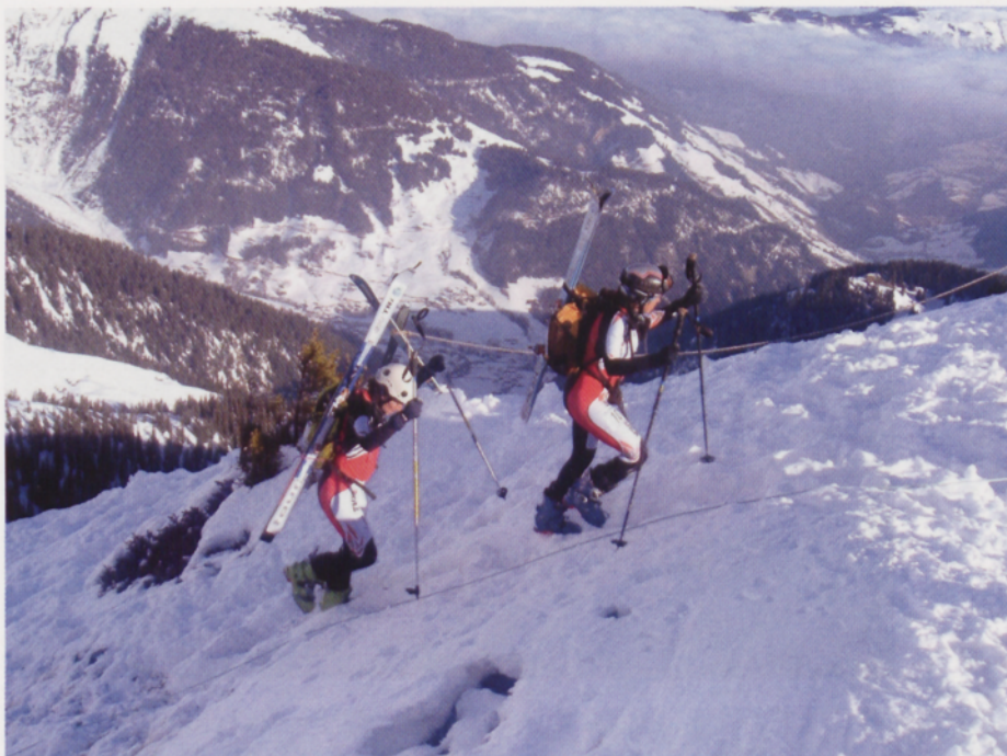
■ El equipo femenino vasco en la Pierra Menta