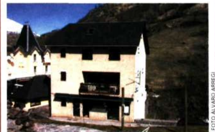
La casa de Gavarnie