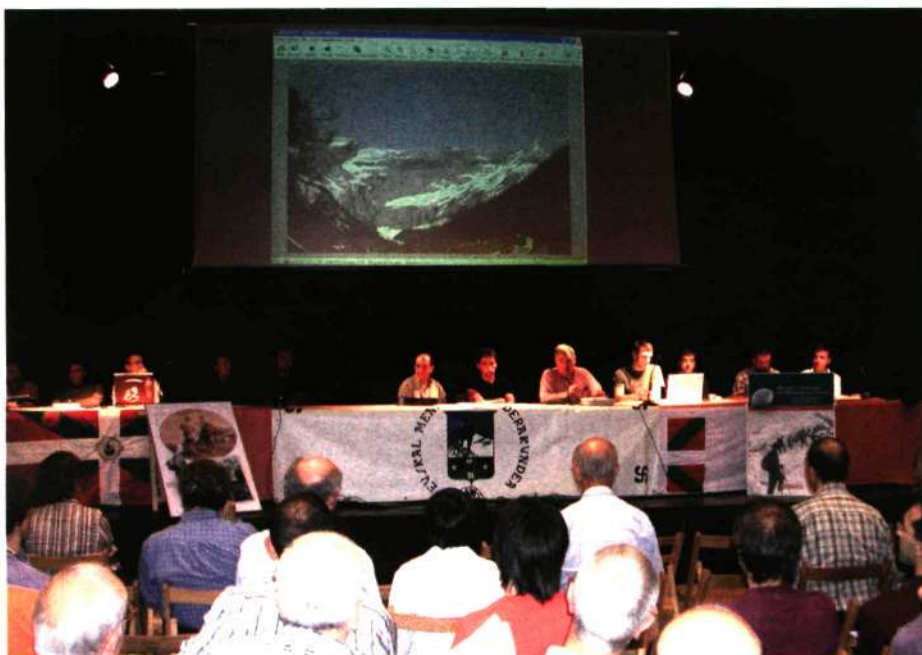
■ Un momento de la Asamblea