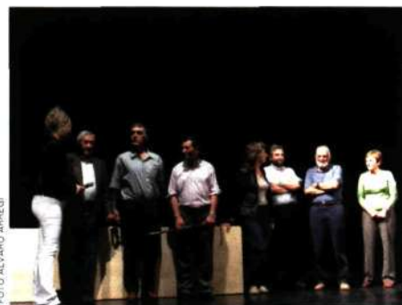
■ Presentación de la expedición al Dhaulagiri

Lo cierto es que los visitantes han mostrado un especial interés por las actividades paralelas organizadas durante la feria. Cuatro de esas actividades, concre-