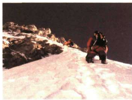
■ En el último corredor o couloir del G-3.

El 50 aniversario de la primera ascensión al K-2 ha acompañado este año todos los focos y altavoces del escenario alpino. El coloso del Karakorum jamás ha conoci-