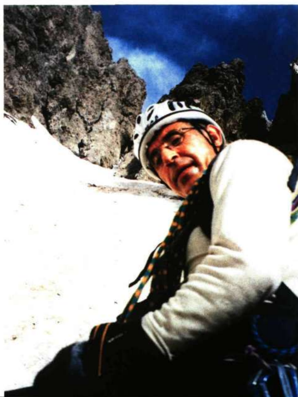
■ En la mitad del corredor