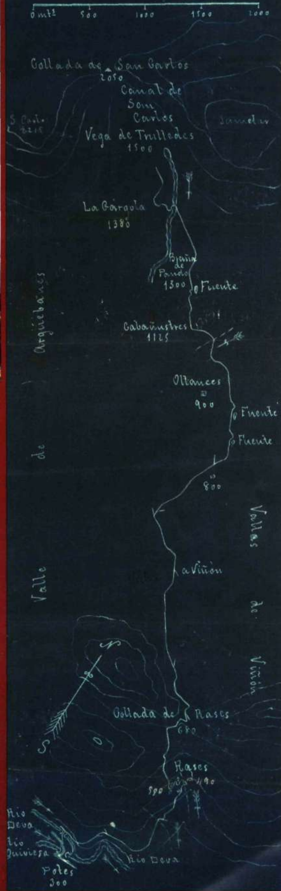
■ Croquis en azulina realizado en 1932 para Sapeña por M. Bustamante