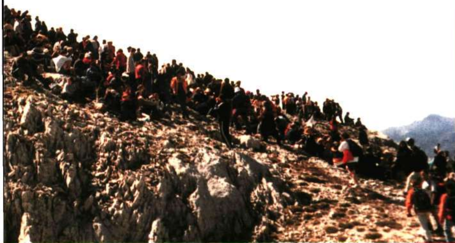
■ Celebración del año 2000

Dado que la afluencia de peregrinos era muy grande, el Ayuntamiento de Cillorigo decidió en 1960 celebrarla cada cinco años, el primer domingo de agosto. El Gobierno de Cantabria la declaró en 1994 fiesta de Interés Turístico Regional.