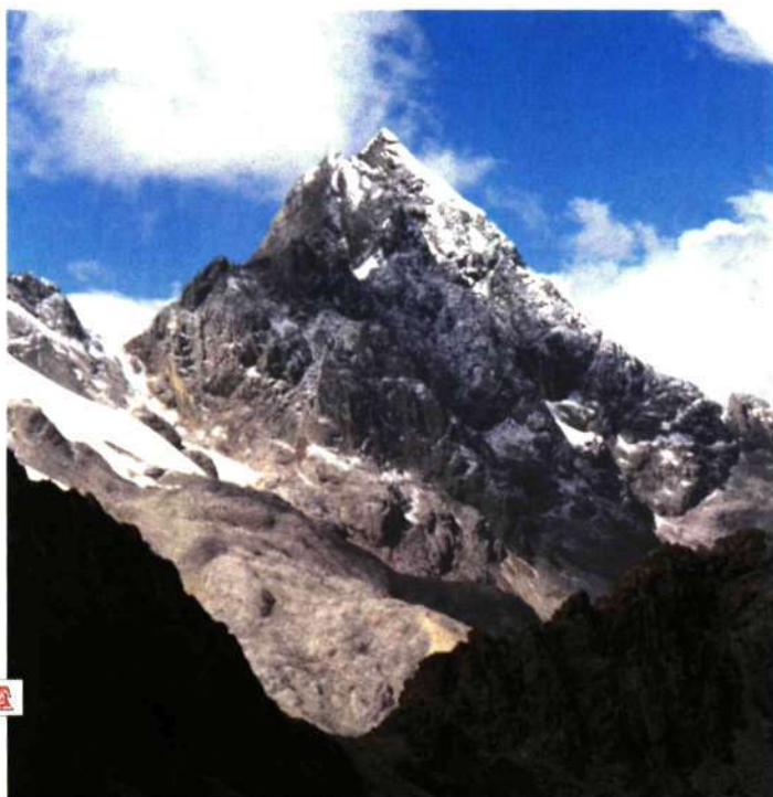
■ Inescalados flancos del Nevado Chácua Grande, 5350 m. Vista desde el noroeste

– Que yo sepa, de un total de unas 50 cumbres de valía, sólo unas 6 ó 7 han recibido ascensión.