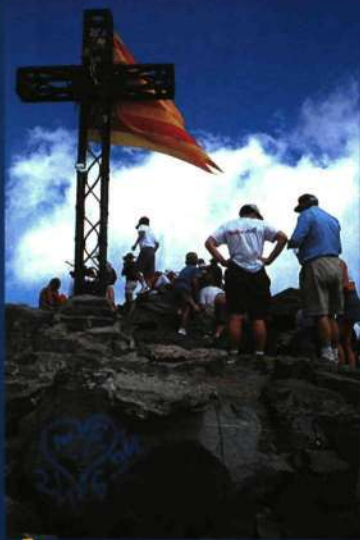
● En la Pica del Canigó nunca faltan las senyeras

En el "Museu de la Casa Pairal" (Perpignan - Perpinyà) existe desde 1955 una llama perenne. Todos los años, en la madrugada del 23 de junio, se traslada a la cima del Canigó para encender una gran hoguera. Desde allí es distribuida por el territorio de los Países Catalanes para prender las populares sanjuanadas.