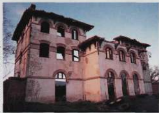
Ruinas de la estación de Kanpezu

En la actualidad, nos encontramos volcados en los proyectos de rehabilitación del trazado como vía verde que la Diputación Foral de Alava tiene en mente desarrollar. Estos son los de Andollu-Túnel de Laminoria y el que discurre entre Antoñana y Zúñiga.