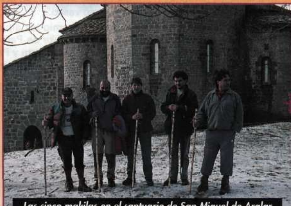
Las cinco makilas en el santuario de San Miguel de Aralar

Por si os animáis a participar en este curioso evento, los tres últimos relevos anteriores al 23 de mayo tendrán lugar los domingos 2, 9 y 16 de ese mes respectivamente, en las cumbres de Oteros, Toloño y Palomares (Araba), Lekanda, Gorbeia y Odoriaga (Bizkaia), Urko, Adarra y Larrunari (Gipuzkoa), Sardekagaiña, Ori y Auñamendi (Iparralde) y Baigura, Kartxela e Hiru Errege mahaia (Nafarroa)