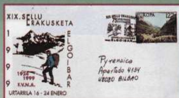
Sobre con el matasellos conmemorativo de la exposición