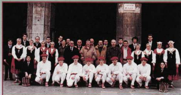
Recepción a la E.M.F. en el Ayuntamiento de Elgoibar