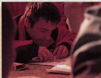
▲ Arriba. Orientación y cartografía A la derecha. Estudio del paisaje humano Debajo. Primeros auxilios ▼

En la elaboración de los módulos temáticos se pensó en la participación del resto de comités que integran la Federación. Tras varias reuniones de coordinación ya teníamos por fin el gran puzzle reconstruido: 15 jóvenes procedentes de la Montaña Alavesa, un total de 130 horas de formación repartidas en nueve fines de semana y otros tantos temas a impartir por once especialistas.