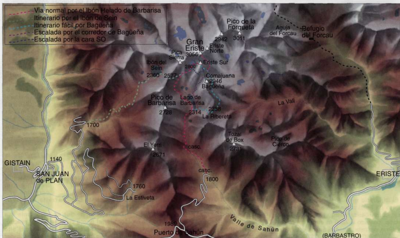
Abajo: Mapa de Eriste