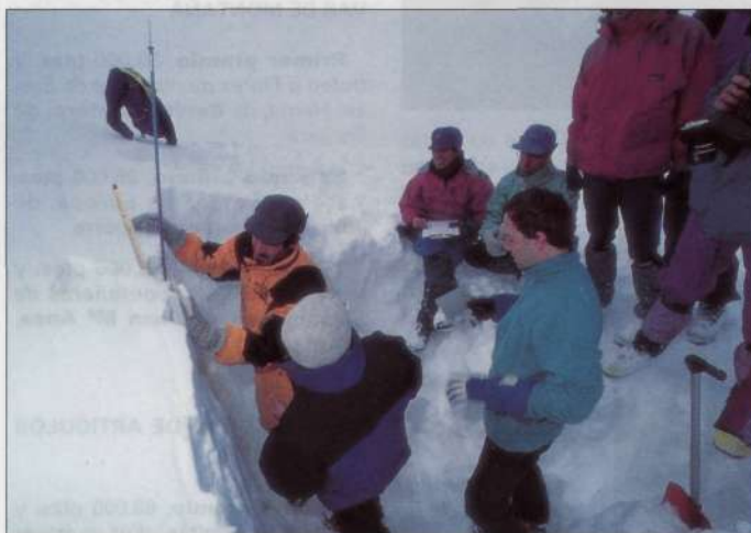
Observación nivometeorológica. Dos instantáneas de los cursos, teórico y práctico