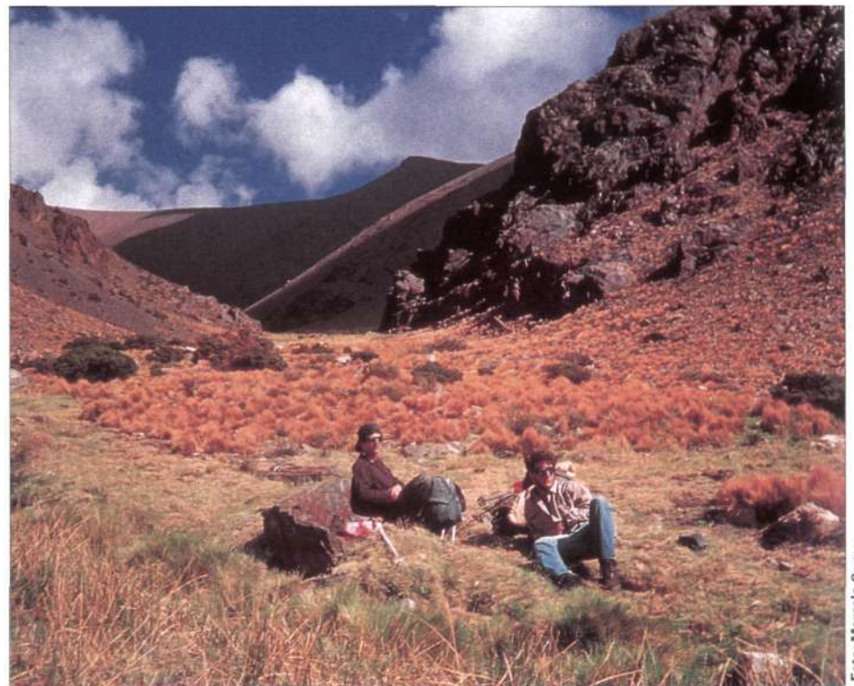
← Cerro el Toro (6.160 m). (Cinco ascensiones)

(1) Ver Beorchia A "El último seísmil", en Pyrenaica n.º 182 (1996)