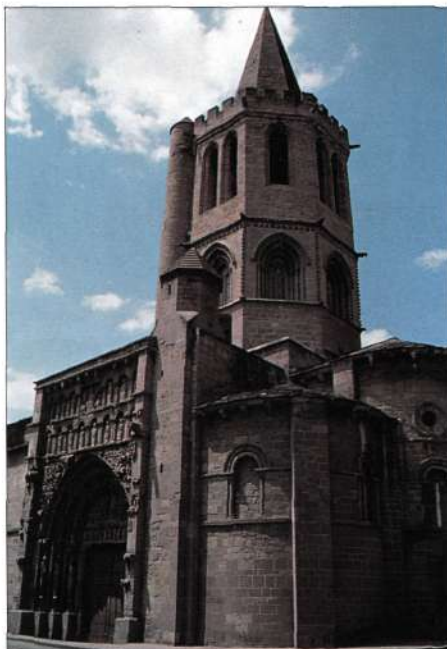
Santa María (Sangüesa)

Desde que en 1986 fue iniciada la red básica de senderos de Nafarroa creada con los senderos GR 11 "Senda Pirenaica", GR 12 "Sendero de Euskal Herria" y GR 13 "Cañada Real de los Roncaleses", la red se ha ido extendiendo con una serie de recorridos de rango interterritorial tal como vimos en el anterior artículo de Pyrenaica . Se trata de unos recorridos en torno a la histórica "Frontera de Malhechores" mugante con Gipuzkoa como son los GR 20