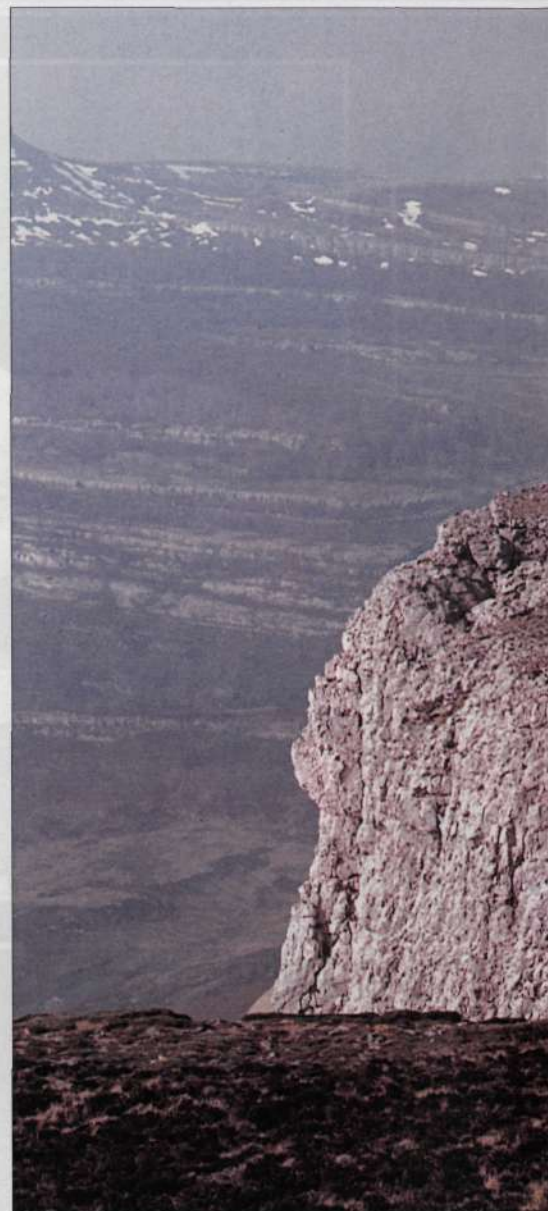
La loma cimera de Las Motas hoy es sólo un recuerdo.