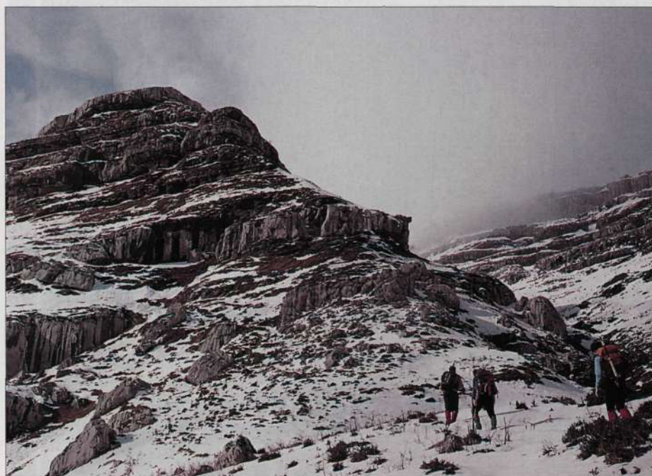
Las estribaciones del macizo adquieren una bella imagen en invierno.

Ni nosotros ni nadie podría subir ya a Las Motas.