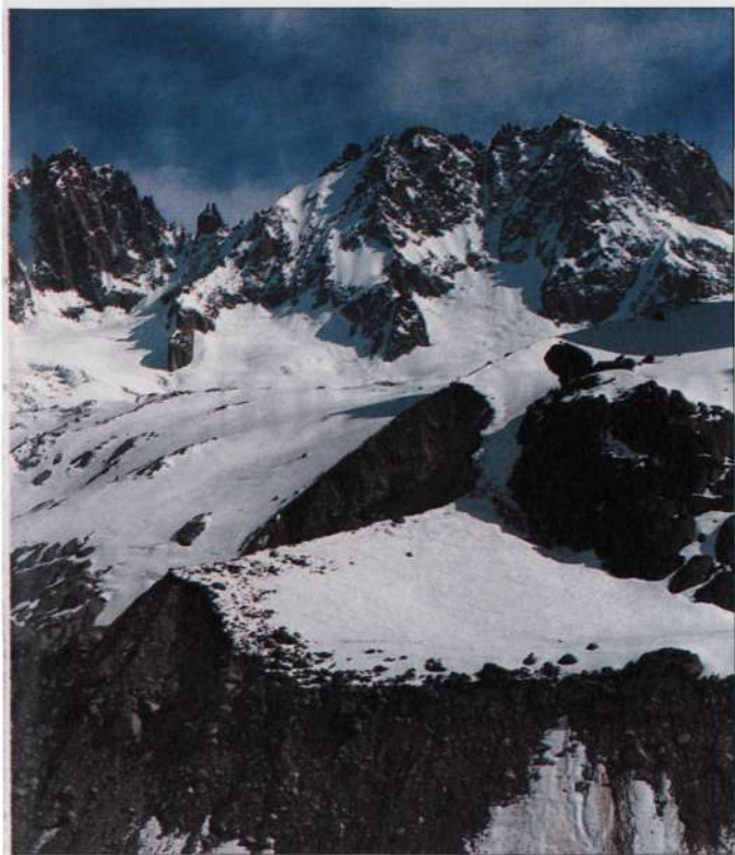
El más bajo de la cordillera: Les Droites, extremo derecho de la foto, tiene justo 4.000 metros. A su izquierda destaca la prestigiosa Aiguille Verte con las dos agujas que ascendió en solitario Blodig a los 73 años.

Nota: Se señalan con las iniciales de cada país las cumbres que hacen frontera y se les atribuye distinta altitud.