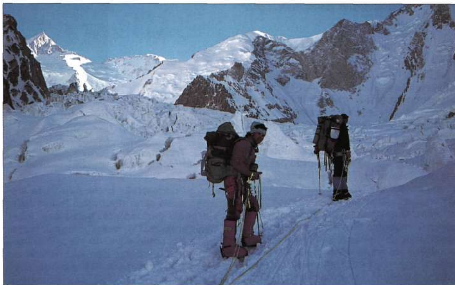
K.I-era iristen. 5.500 m.

-Gehienetan bai, baina ustez arrisksuak ez diren lekutan ez, eta hara zer gerta daitekeen. Handik gora, kontuz kontuz, aldapa geroz eta handiago baitzen, gehienetan elu-