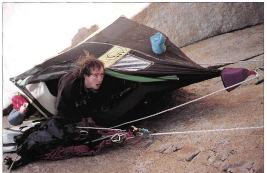
Bibak bat eta erabilitako hamaka A5 Etxekoa.

"El hombro": hemen amaitzen da intsumisioaren gune bertikala, gailurreko arista