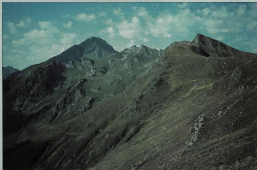
Aspecto de la travesía de cresta de la 1.ª jornada, desde el col de Contente. En primer término el pico Wilson. El la lejanía el Monné (2.724 m.)

Una sugerencia motivadora para los montañeros ávidos de conocer los Pirineos en todos los sentidos.