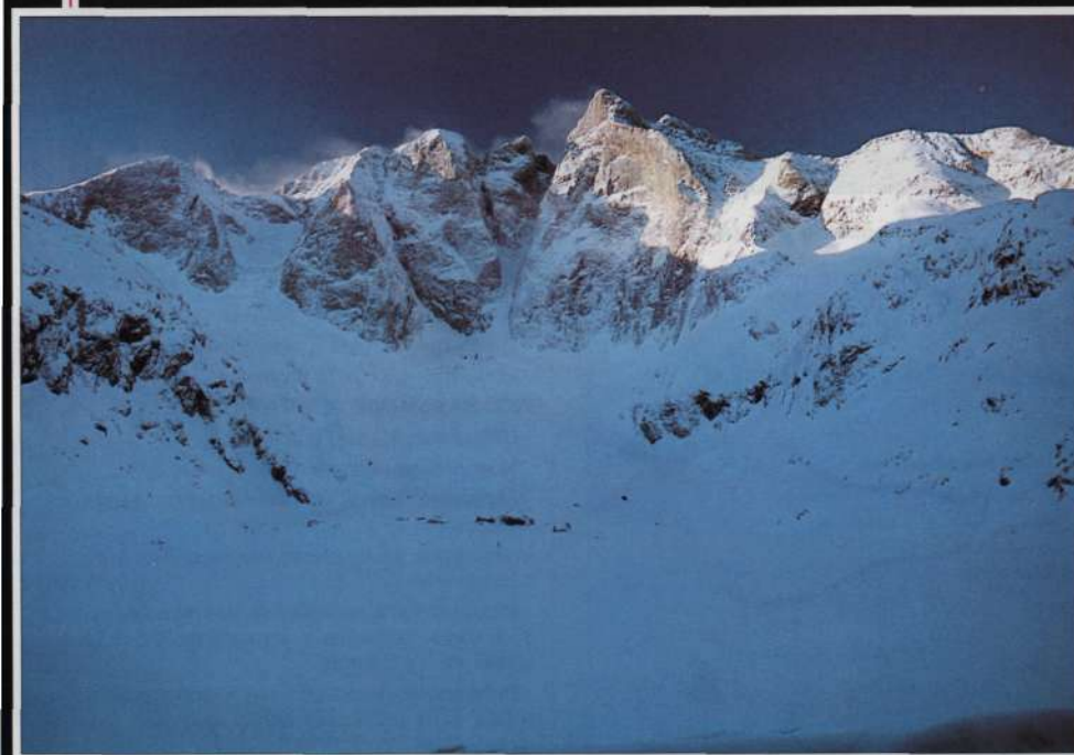
Valle de Gaube. Vignemale