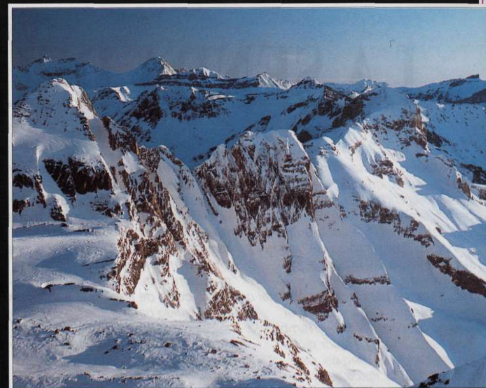
Pico de Pineta. Pico Blanco