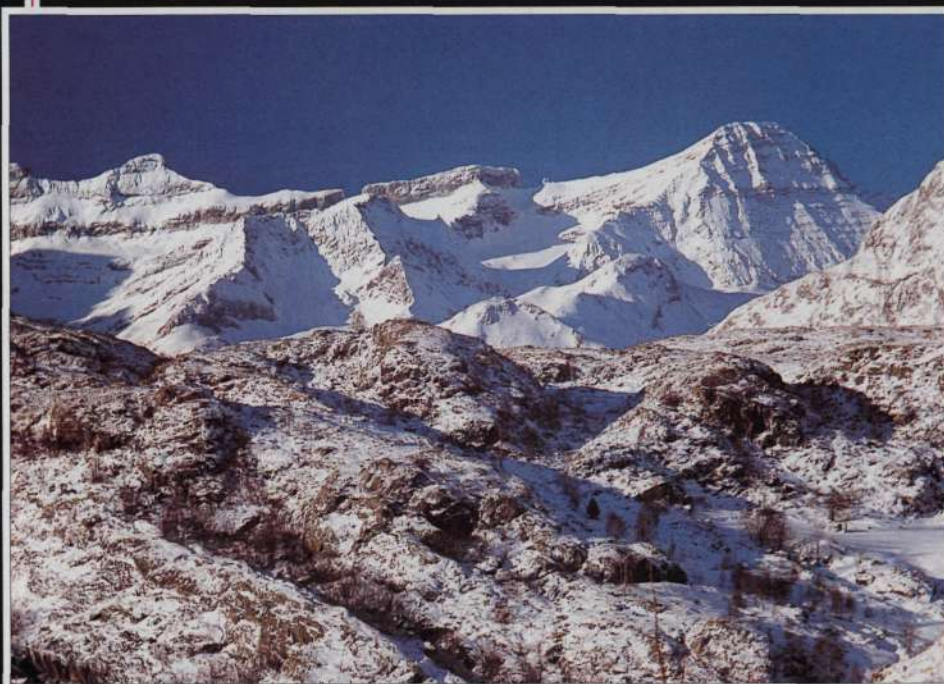
Casco de Marboré y Taillon

Accesit del XIII Concurso de Diapositivas de Montaña de Pyrenaica