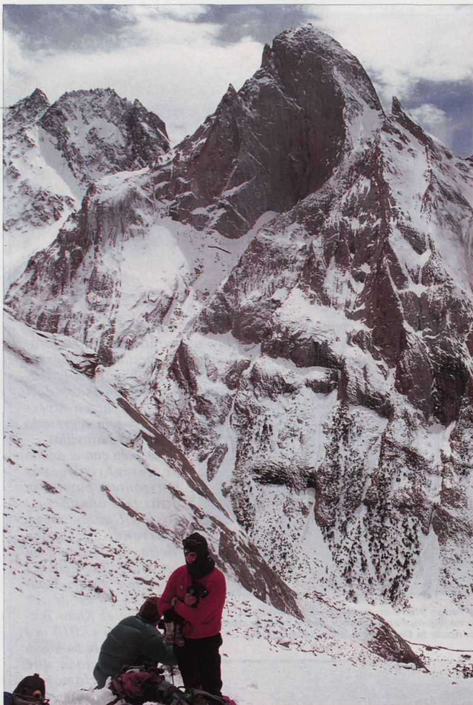
Aproximación al Pico de Slevos