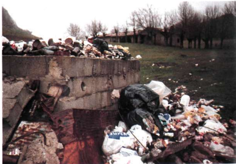
Deprimente aspecto del vertedero de Urbia

Es una vergüenza que a estas alturas del año las instituciones públicas y en especial el Departamento de Agricultura y Espacios Naturales de la Diputación de Gipuzkoa sea incapaz de asumir, organizar, controlar y eliminar los vertederos no controlados, tal como