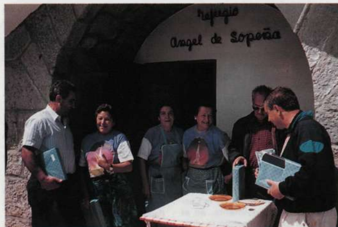
Momento de la reinauguración del refugio de Arraba

El pasado mes de marzo el presidente de la EMF se dirigió por escrito al Director de Deportes del Gobierno Vasco informándole del malestar existente por los continuos abusos que produce la práctica de las motos en el monte. Las molestias se concretan en destrozos de los caminos, sustos al ganado producidos por el ruido, peligros para las excursiones infantiles y riesgo de enfrentamientos con montañeros y pastores.