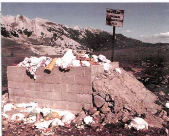
Basura en Urbia

Eso sí, permitiendo siempre el acceso a fores-