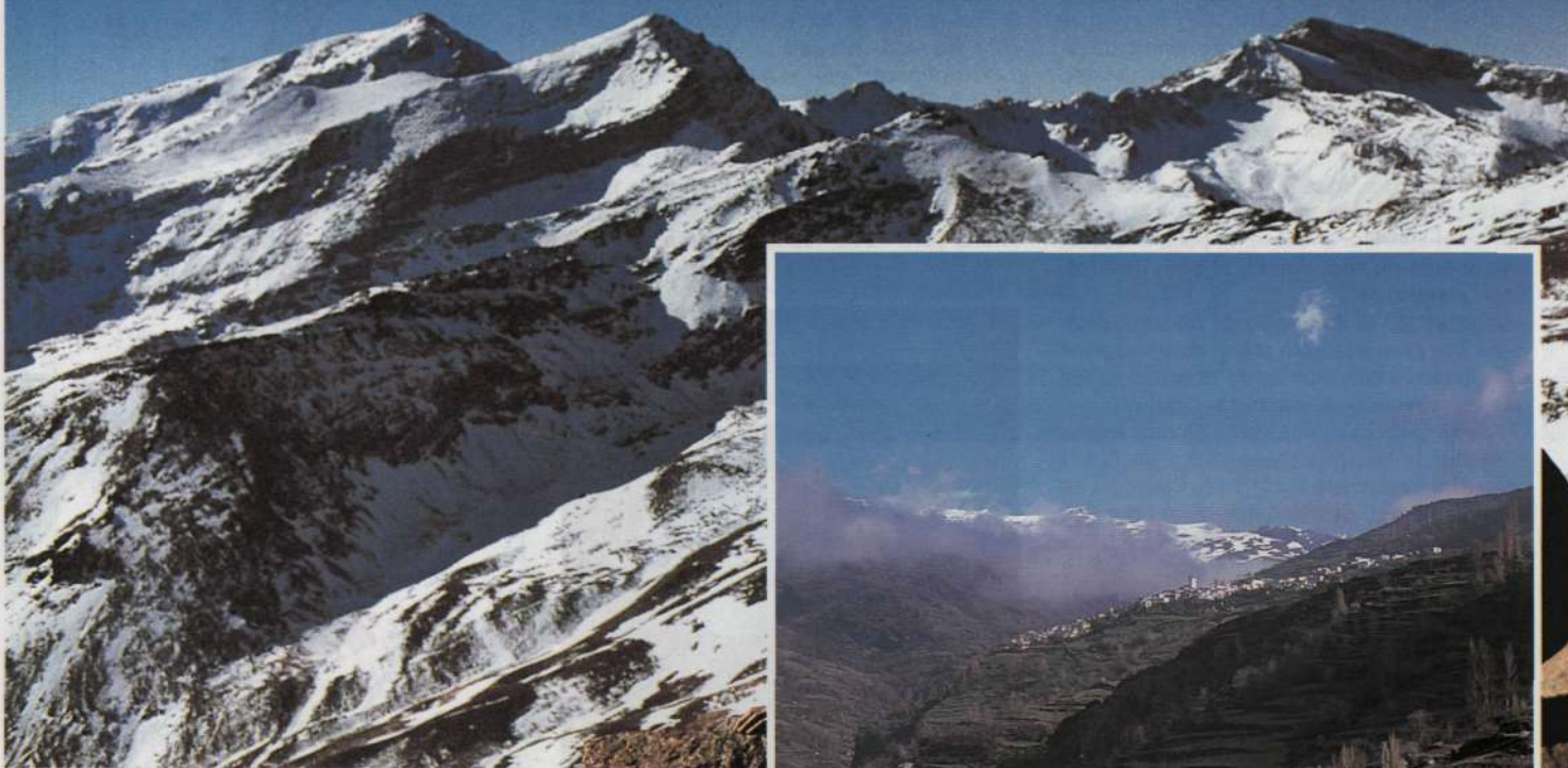
Los tres colosos de Sierra Nevada: Alcazaba, Mulhacén y Veleta (desde el Horcajo).