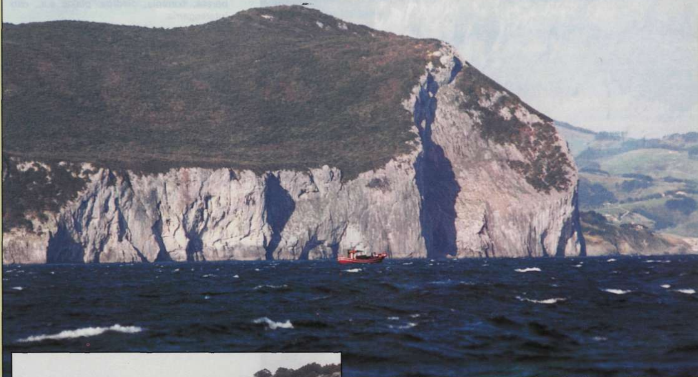
Ogoño, desde el mar y desde tierra.