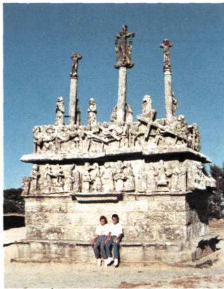
Al pie del Calvario del «enclos» parroquial de Tronoën.

—La Montagne de St. Michel, situada a 3 km al S. de la Signal de Toussaines, al mismo lado occidental de la carretera D-785. Viene mencionada con 380 m (panorama interesante hacia el S.), pero se afirma que se convierte en el techo porque la cima está coronada por una pequeña capilla de 11 metros, con lo que alcanzaría 391 (aparte de que parece un poco exagerado, 11 metros de altura para una «petite chapelle», esto no serviría como altitud real).