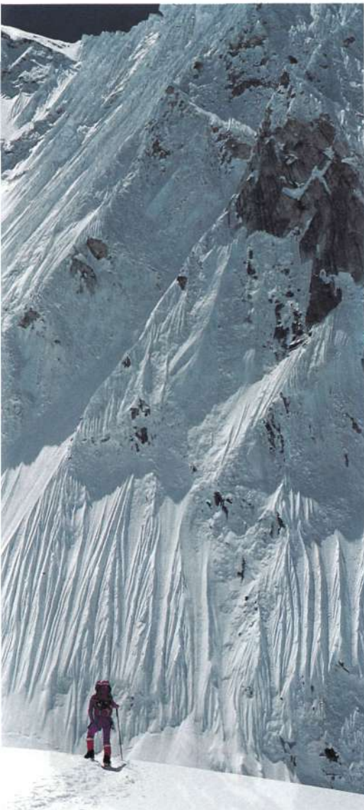
Gizona eta mendia.