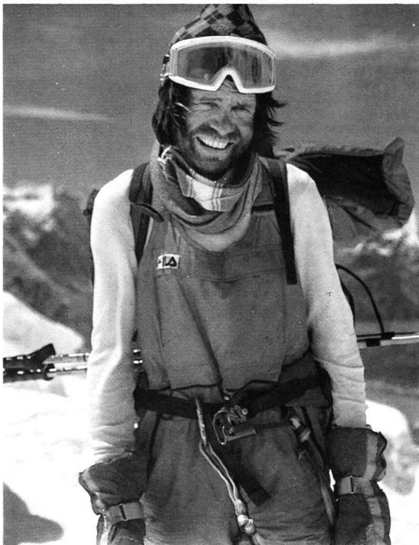
El 16-10-86 Messner conseguía su 14.º ochomil, el Lhotse.