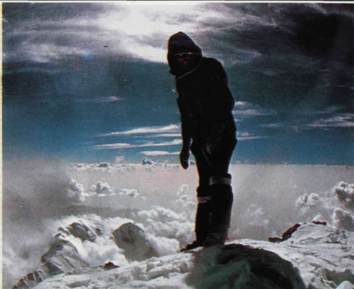
Messner subió en solitario al Nanga Parbat (9-8-78).

Estoy totalmente en contra de las cuerdas fijas que quedan en la montaña; estoy en contra de las marcas y de las guías; en contra de los teleféricos... estoy en contra de todo lo que sea poner barreras a la experiencia de la montaña que tienen derecho a vivir lo que vienen por detrás.