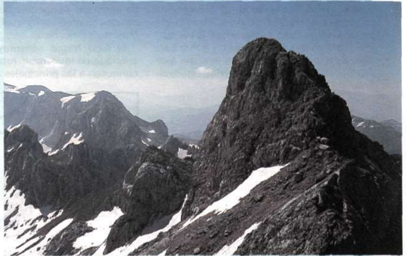
Cresta NNO y cara NE del Bobotov Kuk.