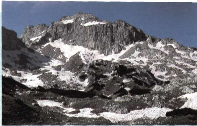
Circo septentrional del Bezimeni.